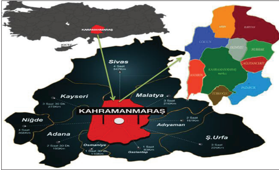
Şekil 2. Kahramanmaraş İlinin Konumu

Kahramanmaraş ili Türkiye'nin güneyinde, Akdeniz Bölgesi'nin doğusunda, 37° 11' ve 38° 36' kuzey paralelleri ile 36° 15' ve 37° 42' doğu meridyenleri arasında yer almaktadır. Kahramanmaraş, kuzeyden Sivas (347 km - 4 saat), kuzeydoğudan Malatya (216 km - 3 saat), doğudan Adıyaman (161 km - 2 saat), güneyden Gaziantep (83 km - 1 saat), güneydoğudan Şanlıurfa (226 km - 3 saat), batıdan Adana (195 km - 2,5 saat) ve Osmaniye (110 km - 1,5 saat) ve kuzeybatıdan Kayseri (273 km - 3,5 saat) illeri ile çevrilidir (Şekil-2). Kahramanmaraş 14.525 km 2 yüzölçümü ile alan büyüklüğü bakımından Türkiye'nin on birinci ilidir. (Kahramanmaraş İl Kültür ve Turizm Müdürlüğü).