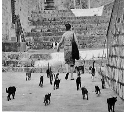
Resim 6. Kotor Kedileri

Tarih boyunca hayvanlar belli toplumlar tarafından sembol olarak seçilmiş veya zamanla sembol haline gelmiştir. (Örneğin panda Çin’de, boğa İspanya’da, kanguru Avusturya’da vs.). Karadağ’ın Kotor kasabasında kedilerin sembolik bir anlamı vardır. Burada yoğun bir kedi popülasyonu gözlemlenmektedir; hatta kedi meydanı adı verilen bir meydan ile geliri Kotor kedilerinin beslenmesi ve bakımı için kullanılan bir kedi müzesi bulunmaktadır. Kasaba kedi figürü ile süslenen hediyelik eşyalar ve biblolar satan çok sayıda dükkâna ev sahipliği yapmaktadır. Bazı Karadağ vatandaşları Kotor’u kedilerin kurtardığına ve kedilerin şans getirdiğine inanmaktadır. 57