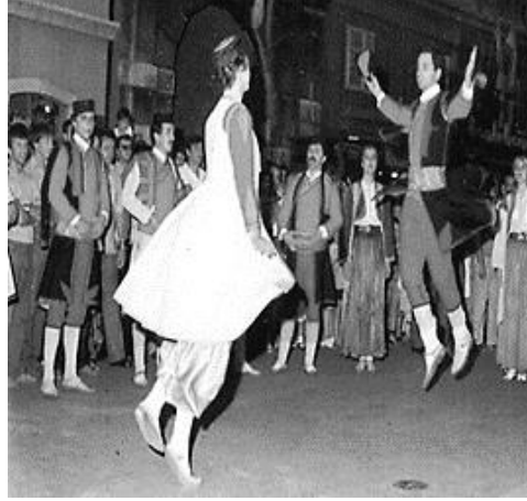
Resim 11. Geleneksel Oro Dansı

bir çember oluşturup şarkı söyler. Cesur genç bir erkek daire içine girer ve bir kartal taklidiyle dans etmeye başlar. Buradaki amaç topluluğu etkilemektir. Çemberi oluşturanlar onu öven ya da şakacı bir şekilde alay eden şarkıyla karşılık verir. Kısa süre sonra erkeğe eşlik etmek üzere daire içine bir kız katılır. Kız kartalı daha zarif bir şekilde taklit ederek erkekle karşılıklı dans etmeye başlar. 67