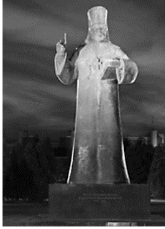
Resim 4: Aziz Petar Heykeli

dağlılara birlik ve beraberlik karşısında kazandıkları zaferi simgelemektedir. Karadağ'ın ilk ve son kralı olan Nikola Petrović Njegoš'un anıtı ise başkent Podgorisa'da yer almaktadır.