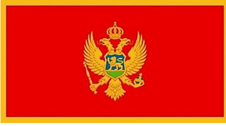
Resim 17. Karadağ Bayrağı

devlet birliğini temsil etmektedir. Çift başlı kartal Karadağ tarihinde ilk olarak son Orta Çağ Sırp devleti olarak bilinen Zeta'nın hükümdarı Crnojevic tarafından kabul edilmiştir. 104 Kartalın göğsündeki kalkanın içinde arka zemini mavi ve yeşil alan üzerinden geçen altın renginde bir aslan figürü bulunmaktadır. Aslan figürü, İncil'deki Hristiyan diriliş temasını temsil etmektedir. 105 Sırp İmparatorluğu tarafından kullanılan sembollerden birisi de aslandı. Aslan figürü Orta Çağ Sırp sikkeleri üzerinde kullanılmıştır. 106 Aslanın sağ pençesinde üstünde haç işareti olan bir asa, sol pençesinde de altın süslemesi ve yine üstünde haç işareti olan mavi bir küre yer almaktadır. 107 Bayrağın tasarımı 1910-1918 yılları Kral Nicola'nın hükümdarlığı sırasında kullanılan bayrağa dayanmaktadır. 108