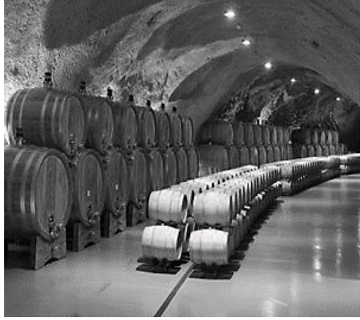
Resim 14. Sipcanik Şarap Mahzeni

de şarap yapımına geçilmiştir. 77 Karadağ küçük bir ülke olmasına karşın, ünlü Planteze bağı 5.700 dönümlük arazisi ile, Avrupa'nın en büyük bağıdır. Planteze'nin Sipcanik şarap mahzeni bir zamanlar Yugoslavya döneminde halk ordusu için uçak hangarı olarak inşa edilmiştir. Günümüzde bu yeraltı mahzenine turistler için günlük turlar düzenlenmektedir. 78