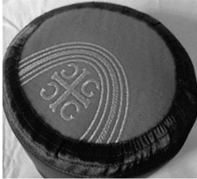
Resim 16. Geleneksel Karadağ Şapkası