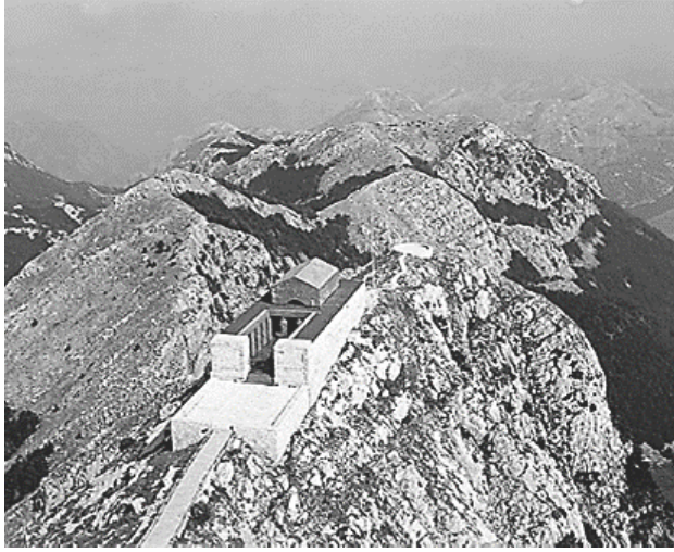
Resim 9. II.Petrović Njegoš'un mozolesi

Karadağ'ın eski kraliyet başkenti Cetinje de Lovcen Dağı'nın altındadır. Yine Lovcen Dağı'nın yamacında Cetinje'de yer alan Njigusi köyü, tarihsel, kültürel ve aynı zamanda duygusal bir öneme sahiptir. Karadağ'ın birçok yöneticisi burada doğmuştur. Njegos'un doğduğu küçük taş ev de burada yer almaktadır. Evin içerisinde eşyaların yanı sıra, 1847'de Viyana'da basılan "Dağ Çelengi" şiirinin ilk baskımının olduğu edebi eser ve Petrović ailesinin soy ağacı da sergilenmektedir. 64