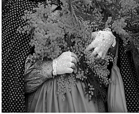
Resim 7. Mimoza Çiçeği

ifadesi için eşsiz fırsatlar sunar. 58 Festival gibi törensel teşhirler aracılığıyla vatandaşlar ortak ulusal üyeliklerine yönlendirilir ve ulusal kimlik sürekli olarak pekişir. Bir ulusu tanımlamak ve sürdürmek o kadar önemlidir ki siyasi liderler vatandaşları ulusun sembollerine bağlamakta hiçbir masraftan kaçınmazlar. 59 Hayvanlar gibi çiçekler de sembolik anlamlar taşır ve bazı ülkelerde çiçekler birer sembol olarak bilinir. Örneğin; lale Hollanda ve Türkiye'nin, ayçiçeği Ukrayna'nın, iris Fransa'nın ulusal simgeleri arasındadır. Karadağ'ın Herceg Novi şehrinin tüm kıyılarını muhteşem bir bahçeye dönüştüren ve kışa meydan okuyan Mimoza çiçeği de Karadağ'daki sembollerinden biridir. 1969'dan bu yana şubat ayının ilk hafta sonundan başlayarak Karadağ'ın kuzey kıyı bölgesinde, her yıl Mimoza Festivali düzenlenmektedir. Festival, baharın gelişini kutlamak için Karadağlıları bir araya getirir. Her yıl yaklaşık 20.000 ziyaretçiyi bir araya getiren festival geniş program yelpazesine sahiptir. Bunların en ilgi çekenleri; yetişkinler ve çocuklar için kostüm partileri, geçit törenleri ve konserlerdir. Mimoza çiçeği insanlar için yeniden doğuşu, baharın vadini temsil eder. 60