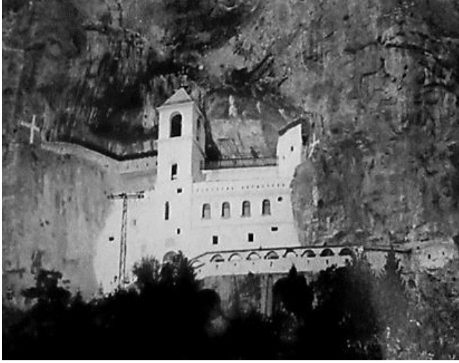
Resim 3. Ostrog Manastırı

yan bu zikzaklı dağ yolunda herhangi bir trafik kazası yaşanmamıştır; bunun nedeni yolun ve yolcuların 17. yüzyılda bu mabedi inşa etmiş Metropolit Vasili Yovanovic'in koruması altında olmalarıdır. Bir başka anlatıya göre; 18. yüzyılda dönemin Karadağ Knezi'nin kardeşi Mirko Petrovic, bir gece yarısı kendi birliği ile Osmanlı askerlerine görünmeden geçerek (Kutsal Ruh onları görünmez kılmış) metropolitin manastırdaki cesedini kurtarabilmiştir. Keramet sahibi Vasili Yavanovic'in kutsal ruhu bu ziyaretgahı İkinci Dünya Savaşı döneminde de korumuştur. Yerel anlatılara göre mabede atılan Alman mermisi, manastırın Kara Haç Kilisesi'ne götüren kapısına isabet etmiş, kapıyı kırmış, fakat patlamamıştır; mermi hala manastırda bulunmaktadır. Yüzlerce ziyaretçi buraya gelerek dua ve yakarırlarının işitileceği inancıyla bahçedeki çeşmenin suyundan içmektedir. 51