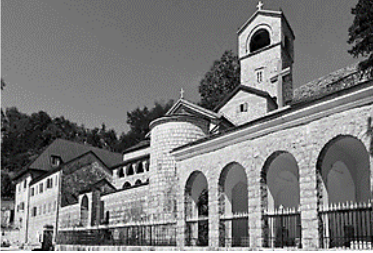
Resim 2. Cetinje Manastırı

misyonuylayla, maneviyatın ve özgür düşüncenin simgesi olarak tanınır. 49