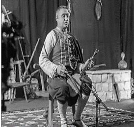
Resim 10. Guslar

ların etkisi altında oluşarak gelişmiştir. Karadağ halk müziği, geleneksel enstrüman olan “gusle” ile yapılır. Akça ağaçtan yapılan bu enstrüman baş kısmında en çok iki başlı kartal, devlet hanedanlık armaları, Lovcen Dağı’nın şekli veya Karadağ tarihinin ünlü karakterleri gibi oyulmuş süslü motifler yer almaktadır. Gusle çalan kişiye ise “Guslar” denir. Çok sayıda insanın toplandığı gusle gecelerinde geleneksel halk kostümü giymiş Guslar, bir sandalyeye oturur, Karadağ’ın çalkantılı tarihindeki savaş ve kahramanlık öykülerini anlatan destansı şarkılar söyler. Bu beceri, ailede ve özellikle Karadağ’ın kuzey kesiminde ve Cetinje çevresindeki bölgede kuşaktan kuşağa aktarılmaktadır. 65