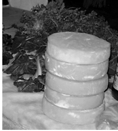
Resim 13. Njegusi Peyniri