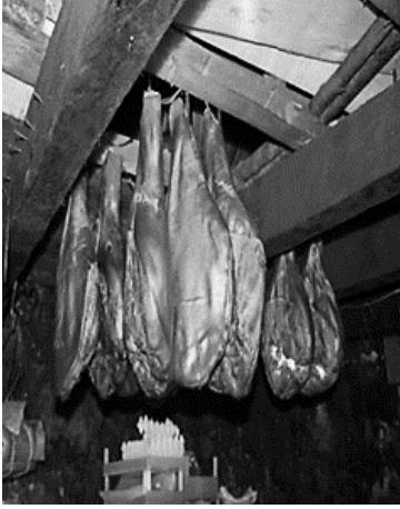
Resim 12. Njegusi Jambonu

alınmıştır. 74 Kurutulmuş et dışında, taze olarak sütle pişirilen ve içe- risinde çeşitli sebze ve baharatların bulunduğu sütlü kuzu yemeği de Karadağ geleneksel mutfağının vazgeçilmezleri arasındadır. 75 Kuşaktan kuşağa aktarılan süt üretimi ve işlenmesi, Karadağlı çiftçi- lerin başlıca uğraşlarından. Hem tarihsel hem de günümüzde Karadağ mutfağında çok çeşitli süt ürünleri yer almaktadır. Üretim gelenegi yaklaşık 120 yıl olan Njegusi peyniri de Karadağ mutfak- ğında ulusal statüye sahiptir. 76