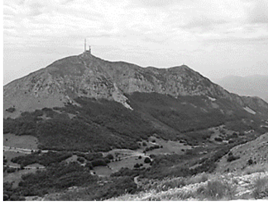
Resim 8. Lovcen Dağı

Bir ulusun inşasında bölgesel görüntüler önemli yere sahiptir. Sosyo-tarihsel ve semiyotik yapılar olarak manzaralar genellikle ulusun kendi algısını yakalamak için görsel bir mecaz olarak kullanılır. Genellikle bu manzaralar, uluslar açısından kendi geçmişleri ile bağlantılı ideolojik anlamlar taşır. 61 Karadağ adının esinlendiği aynı zamanda bir milli park olan Karadağ'ın güneybatısındaki Lovcen Dağı, özgürlüğün sembolü olarak kabul edilir. 62 Karadağlılar ve Sırp-ler için önemli bir şahsiyet olan Karadağ'ın prens piskoposu aynı zamanda şair ve filozof olan Petar I.Petrović Njegoš'un türbesi, dağın 'Jezerki' zirvesindedir.