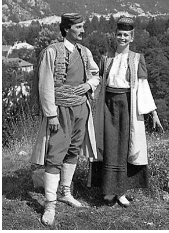
Resim 15. Geleneksel Karadağ Kostümü

rihi sembollerdir. Siyah kısım I. Kosova Savaşı'ndaki Sırp felaketinin yasını, kırmızı kısım dökülen Sırp kanını ifade eder. Beş yarım daire altın işleme ise Osmanlının hakimiyeti altında geçirilen ve Sırlara göre büyük acılar barındıran beş yüz yılı temsil eder. Beş yarım daire içindeki dört "C" (Kiril alfabesinde "S" diye okunmaktadır) harfi Sırları simgeler. Bu harfler, Sırların ünlü sloganı olan Samo Sloga Srbina Spasava, yani "Sadece Birlik olmak Sırları Kurtarır" deyimine işaretler. Şüphesiz Karadağ etno-sembolizminin oluşmasında Orta Çağ Sırp Devleti'nin katkısı büyüktür.