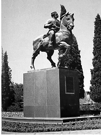
Resim 5. Nikola Petrović Njegoš Heykeli