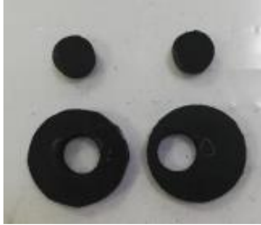
Şekil 1. Aşınma test numunesi

Numunelerin sertlik değerinin belirlenmesinde Shore A sertlik ölçme yöntemi kullanılmıştır. Sertlik ölçümleri ASTM D 2240 standardına göre yapılmıştır. Numuneler üzerine cihazda bulunan batıcı uç malzemeye daldırılır. Dalma ucu malzemede ne kadar az yol almış ise malzeme o kadar sert kabul edilir. Tablo 2’de sertlik test sonuçları verilmiştir. Test sonucuna göre NBR kauçuk içerisine sisal elyaf takviye oranı arttıkça sertlik doğru orantılı artış göstermektedir.