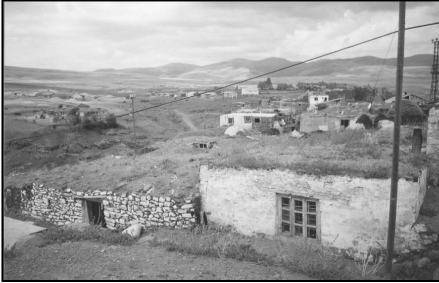
Fotoğraf 4. Tunkaya kyünün kale dıřında kalan blümünden bir grünümler.