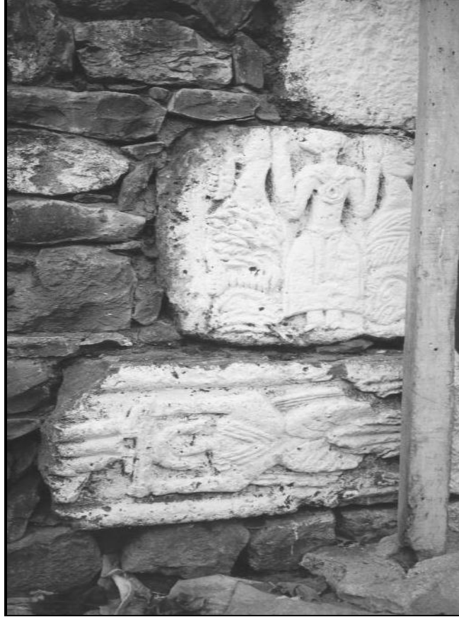
Fotoğraf 6: Tarihi yapılara ait taşlar evlerin duvarlarında inşaat malzemesi olarak kullanılmıştır.

Ekonomik faaliyetler bakımından Tunçkaya köyünde tarım ve hayvancılık hakimdir. Köyün 13922 dekar ekili arazisi vardır. Bu arazinin yaklaşık 250 dekarına mercimek geri kalanına arpa, buğday ekilmektedir. Köyde tahıllardan arpa yetiştiriciliği yoğun şekilde yapılmaktadır. Çünkü köyün serin iklimi ve kıraç topraklarında arpanın verimi buğdaya göre daha yüksektir. Arpa daha çok hayvan yemi olarak önem taşımaktadır. Hakim ekonomik faaliyetin hayvancılık olduğu köyde arpa üretiminin önemi daha iyi anlaşılmaktadır. Arpa üretiminin fazla olduğu yıllar dışarıdan gelen