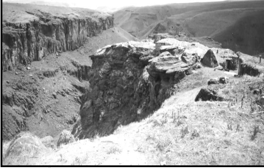
Fotoğraf 1: Üzerine Tunkaya (Geivan) Kalesinin kurulmuş olduėu bazalt kornişleri.