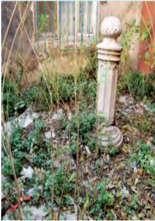
Resim 4: Sultan II. Mahmut Menzili'nin ayak taşı: İkinci Okmeydanı'nda Piyalepaşa Mahallesi'nde, Okçular Çeşme Sokağı ile Şenay Sokağı Atıcılık arasında. Yüksekliği 1,40 m ve dalgalı kenarlı dairesel tabanın dıştan dışı çapı 3,80 m'dir. Acar, (2013).