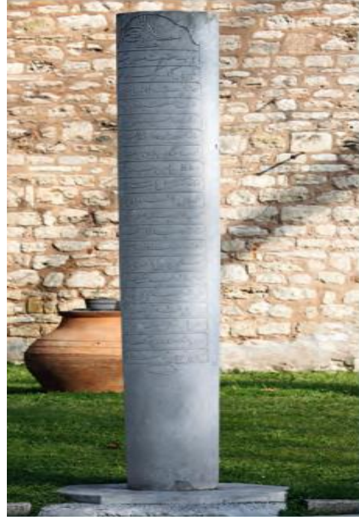
Resim 5: Sultan III. Selim adına dikilen Topkapı Sarayı Avlu'daki 1790 tarihli nişan taşı. Acar, (2013).