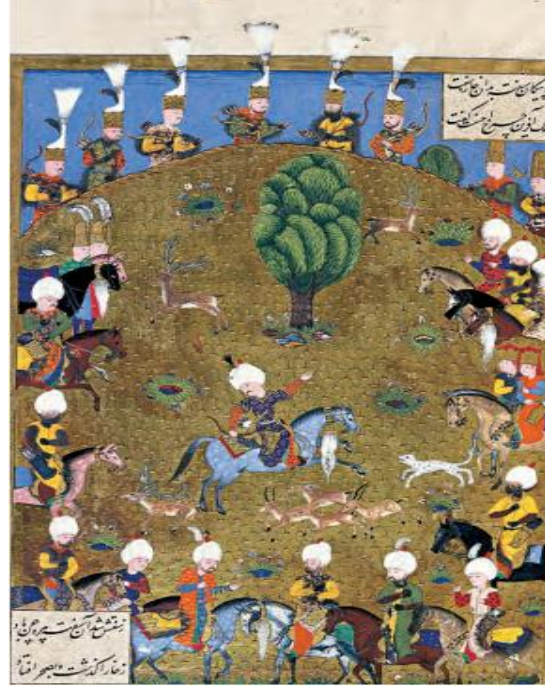
Resim 7: Kanuni Sultan Süleyman'ın okla avlanması (Ârifi) Kuzucu, (2015).