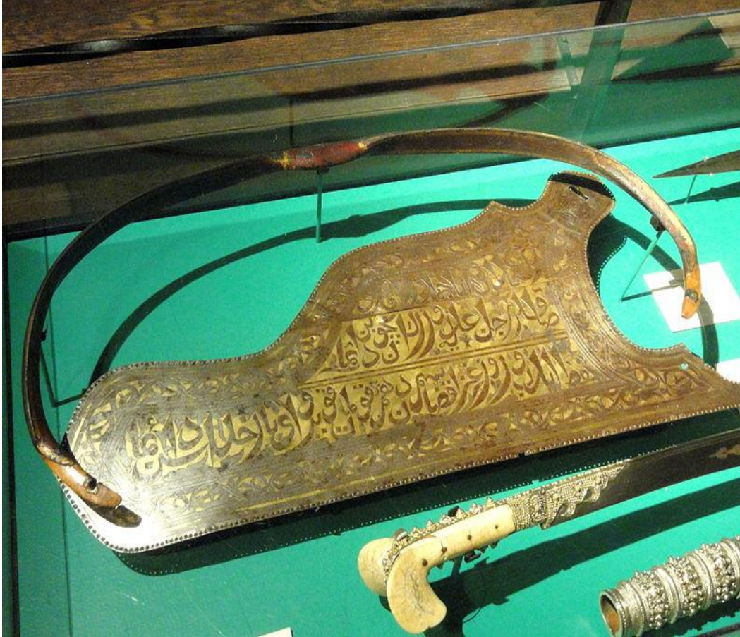
Resim 2: Bileşik (kompozit) Osmanlı Yay 1700'ler

Türklerin ilk dönemlerinde ok, genellikle temren, ahşap çubuk ve yelek gibi kısımlardan meydana gelirdi. Türkler ilk başlarda temreni kemik uçlarından yaparken daha sonraları demirden yapmaya başlamışlardır. Hun İmparatoru Mete Han ise ıslıklı ok diye bilinen oku kullanmaya başlayarak ok ve yay kullanımına farklı anlamlar da katmıştır. Oku taşımak için “sadak, okluk” diye tabir edilen torbalar kullanılmıştır. Oku etkili kullanmak için yay yapımında da ustalaşan Türkler kayın ağacı ile hayvanların boynuz ve sinir, doğal tutkal gibi malzemeler kullanarak yaptıkları kompozit (karma veya bileşik) yay ile savaş meydanlarında üstünlüklerini ortaya koymuşlardır. Yay da tıpkı sadak gibi omuzda taşınır şekildedir. Çünkü Türkler kendilerini silahsız ve savunmasız düşünemezler (Koca, 2002). Osmanlı döneminde kullanılan omuzda taşınır şekilde yapılan birden fazla malzeme kullanılarak at üzerinde kullanılacak kısa bir şekilde yapılmıştır (Resim 2).