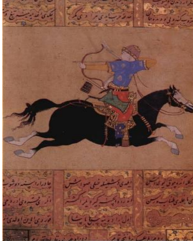
Resim 1: Osmanlı Dönemi Türk Atlı Okçusu. 22.03.2022