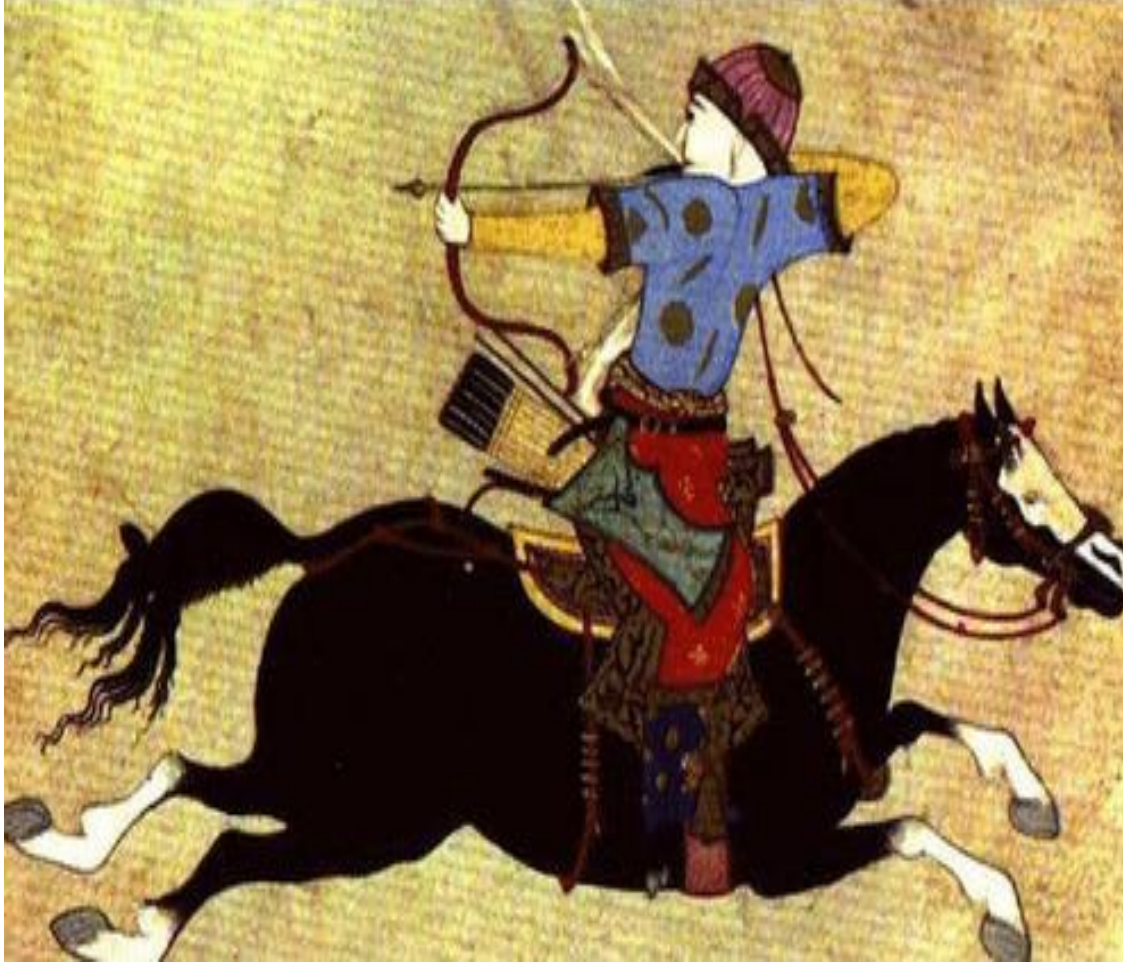
Resim 3: Atlı okçunun savaş becerisi ( https://osmanliyay.tr ). 17.02.2022

herhangi bir yerine temasa dayalı olarak yayı çekmeyip aksine atın hareketine göre yayına yön verirdi. Yayın karma (kompozit) malzemeler kullanılarak elde edilmesi sayesinde kolların ağırlığı sağ ve sol kola eşit denge sağladığından okçu okunu dengesi bozulmadan atışını gerçekleştirebilmekteydi. Bu durumda önemli olan nokta ise kirişin bırakılma anının atın dörtlüyle koşarken ok atmanın gerekliliği idi. Atın dörtlüyle koşarken dört ayağının yerden kesik olan kısacık zaman diliminde “bu an en sarsıntısız an olduğu için” kiriş (yay) bırakılmaktaydı (Resim 3). Bu özellik bozkır atlı okçusu için sanatının zirvesi olarak kabul görmekte ve hassas ritim duygusuna sahip olmayı gerektirmekteydi. Bozkır okçularının gösterdikleri bu yetenekli ve üstün atış tekniği aynı zamanda Osmanlı okçularının gösterdikleri önemli hünere benzerdir.