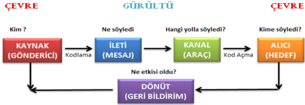
Şekil 1: İletişim Süreci (Civelek, 2014).

bir ifadeyle iletişim sürecinin hem kaynak hem de alıcı tarafından iyi idare edilmesi gerekmektedir. Şekil 1’de iletişim süreci yer almaktadır: