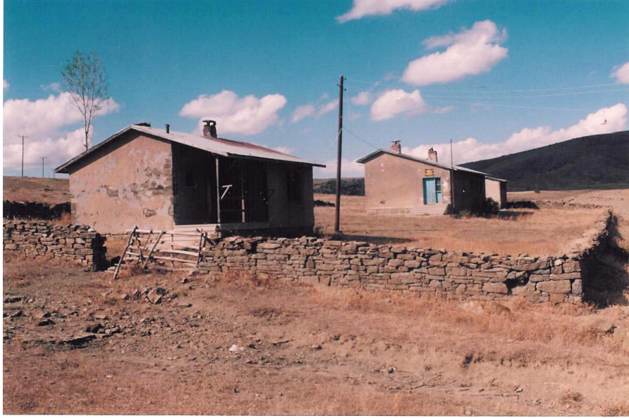
Fotoğraf 1. İlçede Öğrenci Yetersizliği Nedeniyle Kapanan Okullardan Karacaören Köyü İlköğretim Okulu.

İlçede toplam 66 ilköğretim okulu bulunmasına karşın, ilköğretim öğrencilerinin % 42 kadarı (2741 öğrenci) ilçe merkezindeki 7 okulda eğitim görmektedir. Kırsal yerleşmelerde okuyan öğrencilerin % 33 (2077 öğrenci) kadarı belde ve kalabalık nüfuslu köylerdeki 10 ilköğretim okulunda toplanmıştır. Geri kalan 1645 öğrenci ise (% 25) 49 köy okuluna dağılmış durumdadır (Tablo 4 ve 5). Buna göre sadece birinci kademe eğitimin verildiği bu okullarda, okul başına düşen ortalama öğrenci sayısı sadece 33'tür. Şüphesiz bu durum, yörede eğitimin niteliğini ve ayrılan kaynakların verimliliğini olumsuz yönde etkilemektedir. Diğer yandan 27 köy ilköğretim okulu, öğrenci azlığı nedeniyle tamamen kapanmıştır.