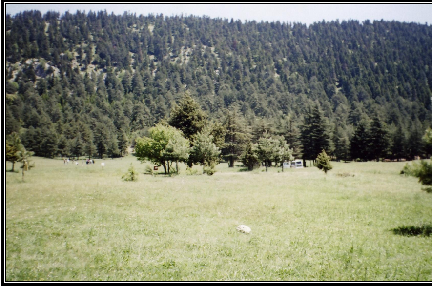
Fotoğraf 1. Başkonuş Dağında Yedi Ardıç piknik alanından bir görünüş

yükselme başlamakta ve mayıs ayında bu değerin 20 C° in üzerine çıktığı görülmektedir. Sıcaklık değerin en yüksek olduğu ay ise ağustos (28 C°) ayıdır. Daha öncede ifade edildiği gibi günü birlik rekreasyonel faaliyetlerin başladığı dönem, sıcaklık değerlerinin 20 C° nin üzerine çıktığı yaz mevsimi ve eylül ayıdır. Bu dönemde sıcaklık değerlerinin insanları rahatsız edecek derecede yükselmesi Başkonuş gibi uygun orman alanlarını, günübirlik de olsa çekici hale getirmektedir.