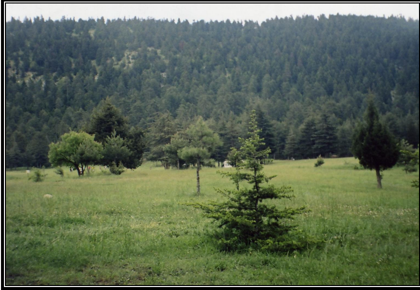
Fotoğraf 3. Başkonuş yaylasında sedir ve köknarlardan oluşan orman sahası

Araştırma alanında bulunan en önemli gününbirlik rekreasyonel saha Yediardıç piknik alanıdır. Bu alanda, önceleri çevre köylüler tarafından işletilen iki kahvehane mevcutken 1984 yılında Kahramanmaraş Orman Bölge Müdürlüğü tarafından 2 adet konut ile 1 adet giriş kontrol ünitesi olarak işlev gören bir bina yapılmıştır. Bunlara ilave olarak 1 adet lokanta, 1 fırın, wc, çocuk oyun parkı, 5 adet çeşme bulunmaktadır. Söz konusu alanın elektrik, telefon, yol ve çevre düzenlemesi de yapılmıştır (Fotoğraf 3).