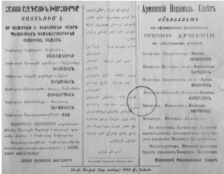
Ek 4. Hovhannes Kaçaznuni Hükümeti'nin Oluşumu; H. Kaçaznuni: Başbakan, A. Khatisyan: Dışişleri Bakanı, A. Manukyan: İçişleri Bakanı, Kh. Karchikyan: Maliye Bakanı ve H. Hakhverdyan: Askeriye Bakanı

Kaynak: https://168.am/2022/02/06/1648194.html