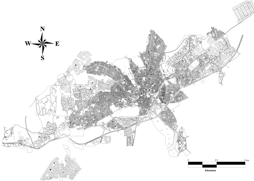
Harita 2: Sivas Şehir Haritası

ait küçük sanayi tesisleri yer almaktadır. Doğuda kurulan organize sanayi bölgesi şehrin bu yöne doğru gelişmesine katkı sağlamaktadır. Şehir merkezinde konut yapılarının, kamuya ve özel sektöre ait hizmet binalarının, fabrikaların ve diğer yapıların belli bir plan içinde geliştiğini söylemek mümkün değildir. Karmaşık bir yapılanmanın söz konusu olduğu şehirde, Mimar Sinan, Yenişehir, Kümbet ve Alibaba gibi yeni konut yapım alanlarının dışındaki eski yerleşim alanları, kent merkezi içinde karmaşık bir görüntü oluşturmaktadırlar (Harita 2).