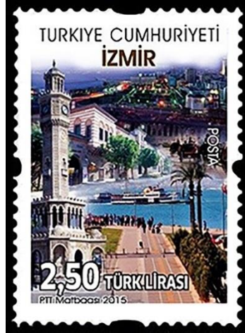
Şekil 1. İzmir kent yaşamı, 26 x 36 mm. (Pulhane, 2015).

Arkeolojik kazılardan elde edilen buluntular, İzmir'in tarihi temellerinin İ.Ö. 3000 yıllarına kadar uzandığına işaret etmektedir. Kentin, kuruluş yeri konusu ise tartışmalı bir takım bilgileri beraberinde getirmektedir. Buna rağmen bugün Bayraklı semtinin sınırları içerisinde yer alan ve önceki dönemlerde yarımada olduğu düşünülen örenyeri, eski İzmir'in kuruluş yeri olarak kabul edilmektedir. Bir yerleşim alanı olarak ortaya çıkan ve en erken dönemlerde Samorna veya Smurna sonrasında ise uzunca seneler Smyrna ismiyle anılan kent, Türkler tarafından fethedildikten sonra artık İzmir olarak telaffuz edilmeye başlanmıştır. Mevcut isme (Smyrna) eklenen "i" sesi, zamanla dönüşmüş ve kentin bugünkü ismi olan İzmir ortaya çıkmıştır (Yılmaz ve Yetkin, 2002, s 21-25).