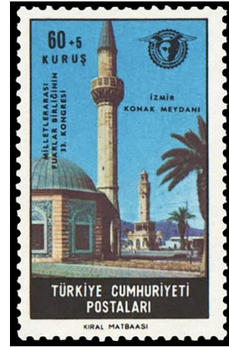
Şekil 6. Yalı Cami , 41 x 26 mm.