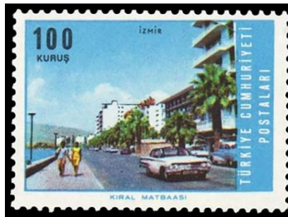
Şekil 7. İzmir Kordonboyu , 36 x 26 mm. (Geçmişten Günümüze Posta, 2007, s. 335).