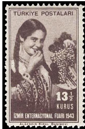
Şekil 4. İzmir Enternasyonal Fuarı. (Geçmişten Günümüze Posta, 2007, s. 330).

Şekil 3'te, 2013'te tedavüle çıkarılan ve 5. İzmir İktisat Kongresi konulu çalışmayı oluşturan 1.10 Krş bedelli pula yer verilmiştir. Baskı sayısı 100 olan bu pulun grafik tasarımcısı Tuğba Yazıcı'dır (Pulhane, 2013). Yatay bir kompozisyonun tercih edildiği bu tasarımda çalışma alanı \frac{1}{3} 'lük paylara bölünmüştür. Altın sarısı renk tonuyla doğal bir çerçeve görünümü kazandırılmaya çalışılan bu tasarımda dantellere kadar baskı yapılmıştır. Solda yer alan ve temsili beş farklı renge boyanarak, çizgi grafik biçimi verilen göstergelerin hemen altına beyaz renkli saat kulesi konumlandırılmıştır. Sağındaki, mavi küre üzerinde yer alan Türkiye görseli ise turuncu renk tonuyla ön plana çıkarılmıştır. İllüstratif açıdan beyaz renk tonunun hâkimiyetini sürdürdüğü bu çalışmanın üstün kısmındaki boşluğa Türkiye Cumhuriyeti orta kısmına ise 5. İzmir İktisat Kongresi ifadeleri yerleştirilmiştir.