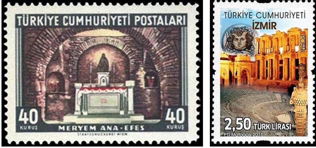
Şekil 11. Meryem Ananın Evi , 36 × 26 mm. (Geçmişten Günümüze Posta, 2007, s. 335).