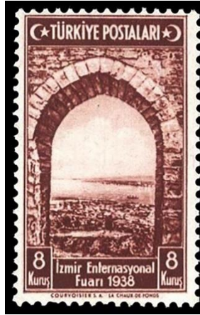
Şekil 2. Kadifekale-İzmir Körfezi, 26 x 41mm. (Geçmişten Günümüze Posta, 2007, s. 328).

İran seferi başlarında, Anadolu'daki Pers İmparatorluğu'nun bir kolunu yendiği rivayet edilen Makedonyalı Büyük İskender, ordularıyla birlikte buradan Efes'e doğru ilerlemeye başlar. Bu harekât sırasında İzmir'e ulaşan Büyük İskender, bugünkü Kadifekale civarına geldiğinde ilahi bir işaret alır ve bulunduğu alana yeni bir kent kurar. Eski Smyralıların soyundan gelenler ise bu kentin ilk sakinlerini oluşturmaktadır (Yılmaz ve Yetkin, 2002, s. 21-25). Dolayısıyla kentin tarihi üzerine yapılan araştırmalar ve tarihi kayıtlar en eski kent merkezinin Pagus Dağı ismiyle anılan Kadifekale eteklerine kurulduğunu doğrular niteliktedir. Önceleri Müslüman Türklerin yaşadığı bu alana Cumhuriyet döneminden sonra Girit ve çevresinden gelenler yerleştirilmiştir. Bakla ve üzüm yetiştiriciliğinin yaygın olduğu tarlalar 1950'lerden sonra imara açılmıştır. Sonraki süreçte yaşanan iç göçlerle birlikte Kadifekale'nin sosyo-politik yapısı tamamen değişmiştir (Çetin, 2011, s. 55-57).