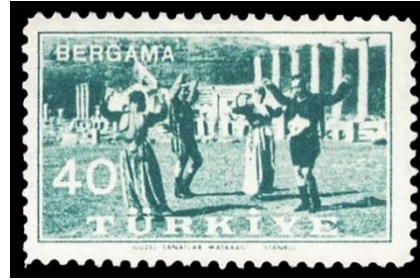
Şekil 9. Pergamon Akropolü, 26,5 x 41 mm. (Geçmişten Günümüze Posta, 2007, s. 320). Şekil 10. Bergama Asklepieion'u ve halk oyunları, 26,5 x 41 mm. (Geçmişten Günümüze Posta, 2007, s. 320).

Şekil 9'da, 1957'de Bergama Kermes Oyunları anısına tedavüle çıkarılan 2'li serideki pullardan ilkinde yer verilmiştir. Baskı sayısı 1.000.000 olan bu pullar, ofset usulüyle iki renkte bastırılmıştır (Pulhane, 1957). Sepya renk tonunun hâkim olduğu bu tasarımda Pergamon Akropolü ve şehir konsepti oluşturulmaya çalışılmıştır. Şekil 10'da, 1957'de Bergama Kermes Oyunları anısına tedavüle çıkarılan 2'li serideki pullardan sonuncusuna yer verilmiştir. Bergama Asklepieion'unun tema olarak kullanıldığı bu tasarımda aynı zamanda yörenin folklorik öğeleri de ön plana çıkarılmaya çalışılmıştır. Çalgıcıların görünmediği bu tasarımda, iki erkek ve iki kadın folklorcunun Bergama yöresine ait halk oyunlarını icra ettiği görülmektedir.