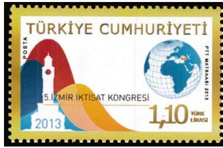
Şekil 3. İzmir İktisat Kongresi, 26 x 41 mm. (Pulhane, 2013).

Hamparsumyan Han'da eş zamanlı düzenlenen "Numune Sergisi" ise hem bugünkü kent vizyonunun oluşmasında hem de kentin sonraki süreçte artık fuar sözcüğüyle birlikte anılmasına etken olmuştur. Ticari faaliyette bulunanları bir biriyle kaynaştırmaya çalışan bu sergide küçük sanayi ürünlerinin yanı sıra; portakal, tütün, incir, zeytinyağı, şeker kamışı, halı, pamuk kozası, makarna, mobilya, ayakkabı, sabun, kolonya gibi ulusal nitelikli ürünler yer almıştır (Dadyan, 2018, s. 206; Gülbudak, 2022, s. 139). Numune Sergisinden alınan ilham üzerine 4 Eylül 1927'de İzmir Valisi Kazım (Dirik) Paşa'nın desteğiyle İzmir Sanatlar Mektebi'nde 9 Eylül Sergisi düzenlenmiştir. Sergiye 71 resmi kuruluşun yanı sıra 195'i yerli 72'si ise ABD, Almanya, İtalya, Rusya, Fransa ve İsviçre gibi ülkelere ait olan firmalar katılmıştır. Yerli ve yabancı ürünlerin bir arada sergilendiği uluslararası nitelikli bu organizasyon, İzmir Enternasyonal Fuarı'nın ilki kabul edilmektedir. Bundan başka iki mekânsal değişim daha yaşanmıştır. Bunlar bugünkü Swiss Otel Grand Efes'in bulunduğu alanda faaliyetleri sürdürülen 9 Eylül Panayırı ve 1936'dan günümüze kadar devam eden Kültürpark ve İzmir Fuar alanıdır (Karpat, 2009, s. 201).