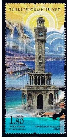
Şekil 5. İzmir Saat Kulesi , 36 x 78 mm. (PTT Life, 2017, s. 109). mm. (Geçmişten Günümüze Posta, 2007, s. 335).

Modern kent olgusunun oluşmaya başladığı XIX. yüzyılda İzmir'in kamusal mekânları da ortaya çıkmaya başlamıştır. Günümüzde Konak Meydanı olarak bilinen alan adımı, Katipoğlu ailesinin konağında almaktadır. O dönemde konakta Katipoğlu Mehmet Ağa ikâmet etmekteydi. Konağın, cümle kapısının önündeki boşluk ise günümüzdeki Konak Meydanı'nı oluşturmaktadır. 1829'dan sonraki süreçte bu konak, idari bir bina olarak hizmet vermeye başlamıştır (Yılmaz ve Yetkin, 2002, s. 60; Yılmaz, 2003, s. 10). İzmir'in sembolleri arasında yer alan İzmir Saat Kulesi ise Konak Meydanı'nın denize bakan tarafına konumlandırılmış sembolik bir yapıdır. Sultan II. Abdülhamid'in tahta çıkışının 25. yıldönümü anısına inşa ettirilen ve kent mimarisinin, oryantalist eğilimli yapıları arasında yer alan saat kulesi 1 Eylül 1901'de törenler eşliğinde açılmıştır (Ersoy, 2000, s. 278; Yılmaz, 2003, s. 16). Kütahya çini sanatının etkisini yansıtan Yalı Cami'nin 18. ila 19. yüzyıllar arasında Konak Meydanı'na inşa edildiği düşünülmektedir. Günümüzde müstakil olarak saat kulesine yakın bir konumda bulunan Yalı Cami, yanı başındaki Yeni Medrese ile birlikte (zaman içerisinde yıkılmıştır) Ayşe Hanım adındaki bir hayırsever tarafından yaptırılmıştır (Taş, 2019, s. 35-36).