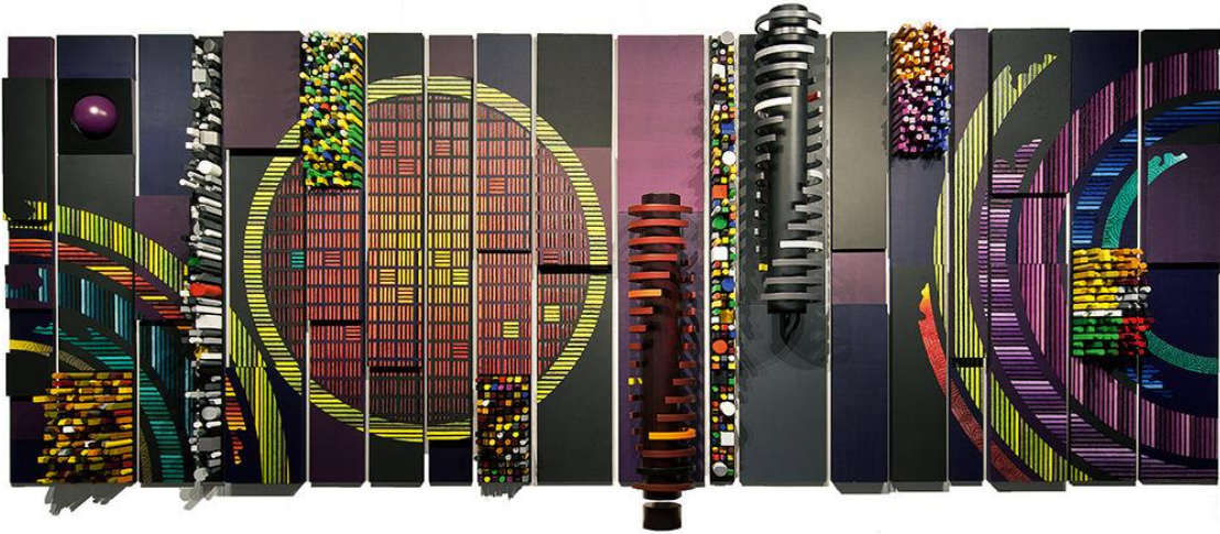
Şekil 5. Paradoks (2012), (2) (Figure 5. Paradoks (2012))

Güneştekin tam da çoğaltmanın eşiğinde, art arda, yaptığı hamlelerle, deneyci bir kimliği de öncelmiş olduğunu vurgulamaktadır. Güneştekin'in 2007 yılında, AKM'de açtığı ve o güne dek kat ettiği dönemleri kapsayan sergisinin ardından, iki yıl içinde, pek çoğu anıtsal boyutlarda olan sırasıyla "Boyutlu Tuvaller", ardından "Kapılar Serisi" ve "Boşluklu Tuvaller" i tasarlamış ve işlemiştir. Sanatçı üretim sürecinde resmini değiştirmemiştir ama mekanla oynamış, başka bir deyişle, bu üç farklı konumlanmanın ortak derdi yüzey değil, tuval olmuştur. Boyutlu tuvalerde, kapılar, sarmaşık gibi yayılan, sıkı istiflenmiş imge ve renk örgüsü tarafından, kesintisiz biçimde kuşatılmıştır. Sağlam ve oldukça dinamik biçimde konfigüre edilen bu rölyef tuvaler, duvardan kopmak yönünde güçlü bir eğilimi açığa vurmaktadır. Tuvaldeki kompozisyon sanki heykele dönüşme çirpinişi içindedir, (Şekil 5).