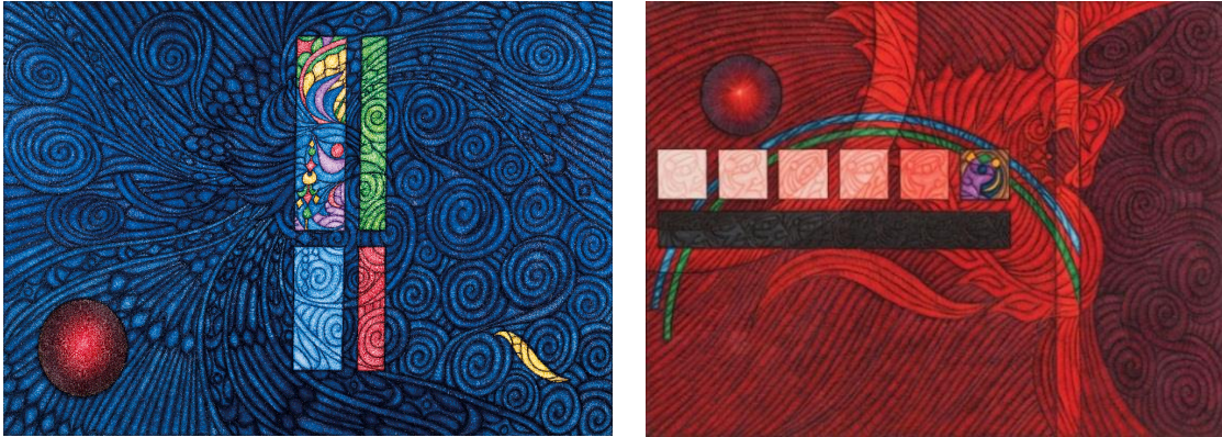
Şekil 1. "Simurg (2006)" ve "Akhilleus'un Askerleri (2009)" (1), (4) (Figure 1. "Simurg (2006)" and "The Soldier of Akhilleus (2009)")

Güneştekin, yapıtlarından söz ederken "geleneğe" kavramını kullanmaktadır. "Geleneğe" geleneğe ek demektir yani bir üst üste eklenme, birikme, artma, çoğalma, aradalık durumu vardır. Bu kavram aslında metnin neden katmanlar üzerine kurulduğunun bir başka savunmasıdır. Sanatçı geleneği, kültürü, yeri, yolu, rengi, zanaatı, hikayeyi, efsaneyi, insanı ve iyileştirici özelliği olan tüm kavramları sahiplenmektedir. Bu sahiplenme onları korumak ve yeniden üretmekle vücut bulmaktadır.