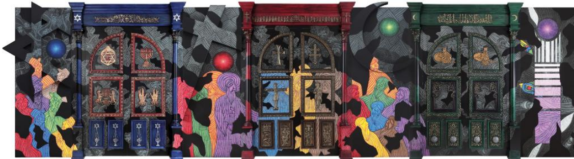
Şekil 3. Güneşe Açılan Kapılar (2010), (3) (Figure 3. Doors Opening to the Sun (2010))

Ahmet Güneştekin' in kendi kendini yetiştirmiş bir sanatçı olması ona çağdaş sanatçılar arasında bir yer tayin etmeyi çok zorlaştırmaktadır, çünkü onun işleri günümüz sanatındaki hiçbir estetik söylemle doğrudan bağdaştırılamamaktadır. Sanatçı taslaklar hazırlamaz ama tuval üzerindeki çalışmalarını ön-çizimler ile birlikte yapmaktadır. Orada ışık huzmeleri, bezemeler, yüzeyler yani "geometri" katmanı bulunmaktadır. Ardından resim yüzeyinin bir köşesine sezgisel bir biçimde renk uygulamaya başlamakta, geometrik plan ve resimsel dinamik arasındaki bu diyalektik, tarihsel bilginin ve bilinçaltının ortak etkinlik alanını oluşturmaktadır. Sanatçının kendine ait sanatsal bir dil geliştirmekte gösterdiği kararlılık, formların kesintisiz bir biçimde geliştirilmesi, tüm bunlar diğer taraftan hiçbir yanlış anlamaya yer bırakmayacak şekilde, günümüz sanatındaki güçlü bir bireysel konuma işaret etmektedir. Renkle kurulan ilişkideki eşsiz el yazısı da bunun bir parçasını oluşturmaktadır. Resmin duygusal ufkunu belirleyen renkler, sezgiler tarafından yönlendirilmektedir. Ardından gelen geometrik formlar, çoğu zaman eski resimlerden alıntılar biçiminde ortaya çıkarak bezeme yüzeyini