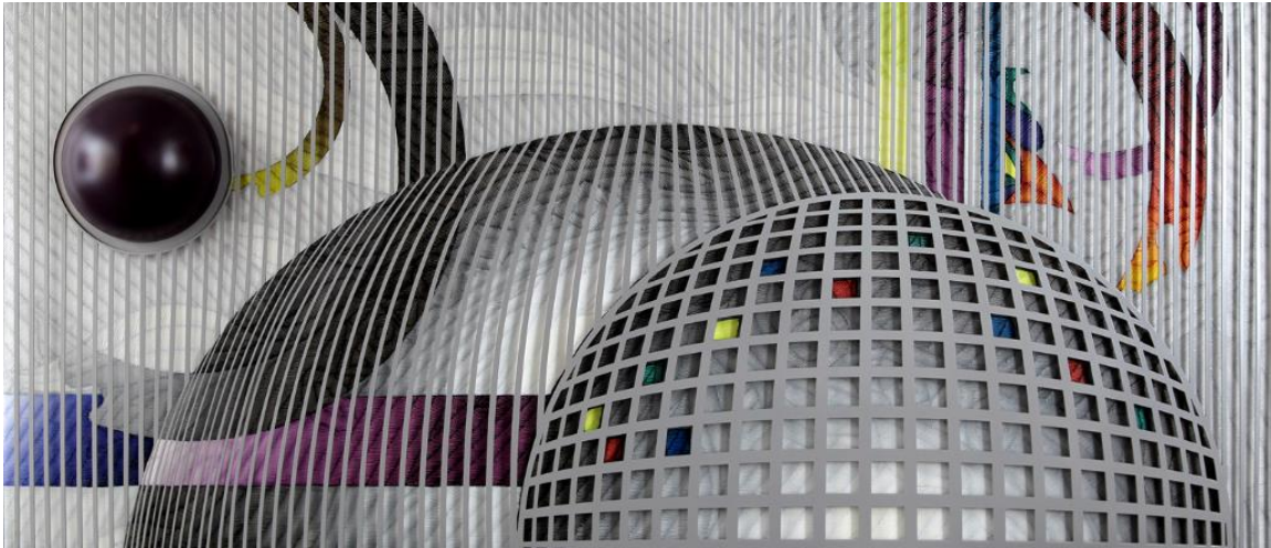
Şekil 4. Binbir Renkli Dünyanın Kanatları (2014), (1) (Figure 4. The Layers of The Many Colours World (2014))

Güneştekin' in renk ve biçim kurguları üzerinde zamanla olgunlaştığını ve içtenlikli bir kararlılığa dönüşerek, bir çözüm modeli yakaladığı düşünülmektedir. Ahmet Güneştekin, "benim işlerim, karanlık ile ışık arasındaki çelişkiyi temsil eder" ifadesini kullanmaktadır. Bu eskiden beri var olan -bir anlamda kalıplaşmış olan- çelişkiyi onun resimlerinde görmeyi mümkün kılmaktadır. Ancak onun karanlığı ve ışığı renklerle donanmıştır, bu da onları daha dokunaklı hale getirmektedir. Güneştekin' in hayal gücü, karanlıktan doğarak ve ışığı aramaktadır. Öz benliği, var olduğu dünyanın karanlığında yer alan -ve "görmesini" sağlayan ışığı aramaktadır. Onun güneşi, geçirgenliği olmayan opak öğeler ve onu içine hapseden kesif koyu şeritler sayesinde var olabilen şeffaf bir ışık küresidir. Güneştekin işte bu yüzden " güneş benim imzam " demektedir.