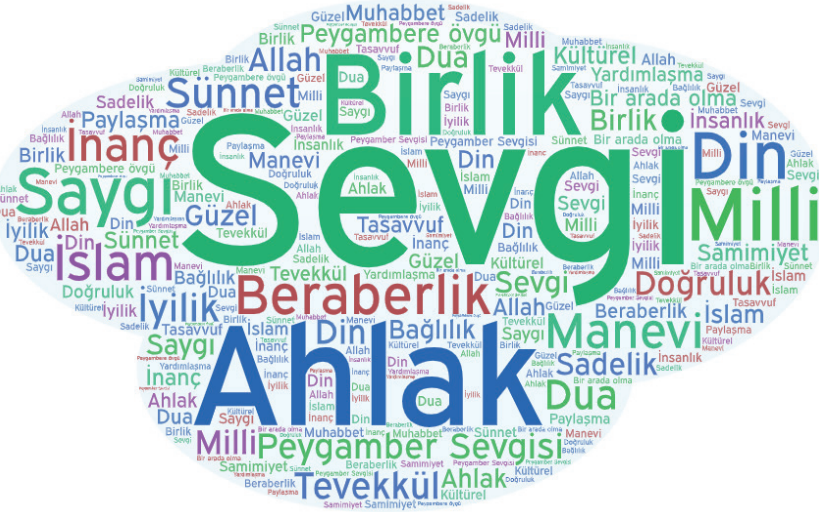
Şekil 3. Süleyman Çelebi, Vesîletü'n-Necât ve Mevlit Geleneğinde Değerler Hakkındaki Yanıtlardan Oluşan Kelime Bulutu

Bu bölümde öğrencilere ikinci olarak Süleyman Çelebi, Vesîletü'n-Necât ve mevlit geleneğinin değerler bağlamında nasıl bir konumda bulunduğuna yönelik sorulara yer verilmiştir. Bu doğrultuda öğrencilere, “Süleyman Çelebi’nin Mevlit’inde hangi kök değerlere yer verilmektedir? Bu değerlerin günlük hayatımızdaki yeri hakkında neler söylersiniz? Neden?” ve “Mevlit oku(t)mak” sosyo-kültürel değerler bağlamında sizce nasıl bir yere sahiptir? Neden?” soruları yöneltilmiştir. Öğrencilerin bu sorulara verdikleri yanıtlardan oluşan kelime bulutu Şekil 3’de görülmektedir.