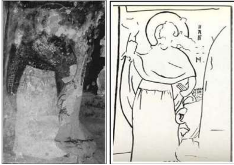
Görsel 4. (solda) Azize Marina elinde çekici saçlarından (boynuzlarından) tutmuş olduğu Beezelub görülmektedir. 11.yüzyıl, Kırk Dam Altı Kilisesi, Kapadokya. (sağda) Aziz Marina ve Şeytan'ın gösterildiği duvar resminden çizim.11.yüzyıl, Kalamun, Suriye.

doğruluğun sembolü olarak Kutsal Kitap'ta yer almaktadır (Oyeniçi, 2018:5). Çıkış 15:6 "Senin sağ elin, ya RAB, Senin sağ elin korkunç güce sahiptir." sözleriyle Tanrı'nın sağ elinin düşmanları yok eden amansız gücünden bahsedilmektedir. Azizenin sağ elinde görülen çekicin Tanrısal gücün ifadesi olduğunu düşünmek yanlış olmayacaktır. Azize Marina'nın ikonografik olarak tanımlamasının yapılmaya başlandığı ve kültünün hızla yayıldığı kötü ruhlardan, kötülüklerden, hastalıklardan koruyucu, şifa verici özellikleriyle Balkan, Makedonya ve Sırbistan'da bir çok kilisenin resim programına dahil olduğu duvar resimleri ve ikonlardan görülebilmektedir.