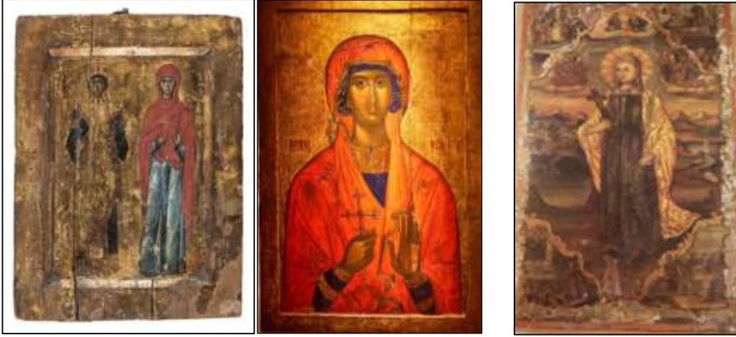
Görsel 3. (solda) Azize Katerina ve Azize Marina elinde haç tutarken gösterilmiştir. 11.yüzyıl, 28x22 cm. Azize Katerina Manastırı, Sina Dağı. (ortada) Azize Marina sağ elinde haç tutarken tasvir edilmiştir. 14-15.yüzyıl, 115x78 cm., Atina (sağda) Azize Marina ikonası, 94x55,5 cm. 19.yüzyıl, Ayasofya Koleksiyonu.

kiliselerinde görülen Meryem tasvirlerini anımsatmakta olup ikonanın dört köşesinde azizenin yaşamından önemli sahneler görülebilmektedir (Yılmaz, 1993: 214).