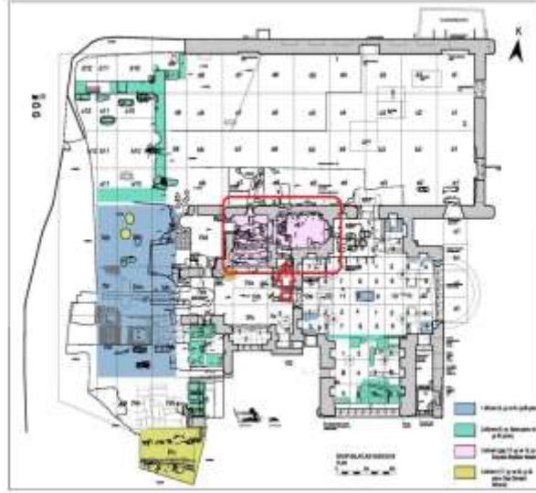
Görsel 1. SBK Planı, Son dönem Kilisesi ve Güney Giriş Kapısı İşaretlenmiştir. SBK 2017 Kazı arşivi.

Son dönem kilisesinin güney cephesinde bulunan giriş kapısı, yarım daire kemer formulu bir kapıdır. Kiliseye basamaklarla aşağıya inilerek ulaşılmaktadır. Kapı lentosunun üst kısmındaki yarım daire alınlığın iç ve dışında yer alan duvar resimleri çok tahrip olmalarına karşın günümüze ulaşabilmiştir. Yarım daire kemer alınlığında oldukça zarar gördüğü anlaşılan kitabe kısmı sökülmüş olup yanında belli belirsiz bir kadın figürü seçilmektedir. Başında hale bulunan kırmızı örtülü bir kadın sol elini havaya kaldırılırken gösterilmiştir. Sağ eliyle ise duvar yüzeyindeki bozulmalara karşın siyah bir objeyi kavradığı görülebilmektedir. Bu çalışma kapsamında Antakyalı Azize Marina olarak tanımlanabileceği düşünülen kadın figürünün kimliği, azizenin yaşam hikâyesi ve bilinen resimleri üzerinden benzerlikler ve farklılıkları ele alınarak değerlendirme yapılacaktır. Araştırmada başta Balatlar Kazı arşivi olmak üzere konu ile ilgili yazılmış yerli ve yabancı makale, tez ve kitaplara ulaşılmaya çalışılmıştır. Balatlar duvar resminde görülen kadın figürünün tanımlanabilmesi ve karşılaştırma örneği olarak kullanılabilmesi için internet kaynakları ve çeşitli kitaplardan görsel malzeme derlenmiş ve çalışmada kullanılmıştır.