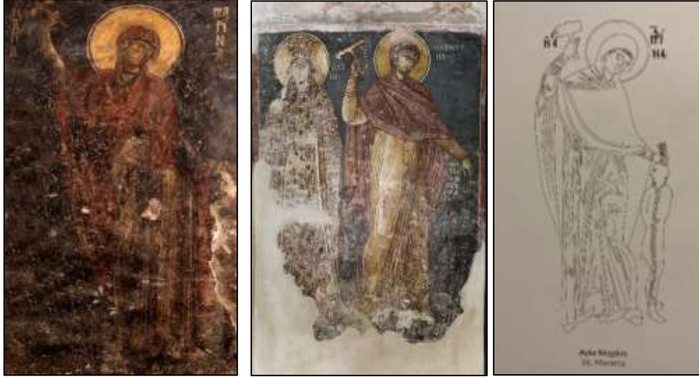
Görsel 5. (solda) Azize Marina, Aghioi Anargyroi Kilisesi duvar resmi, 12.yüzyıl,Kastoria. (ortada) Kraliçe Jelena ve Azize Marina, Beyaz Kilise 14.yüzyıl, Karan, Sırbistan. (sağda) Azize Marina, nartekste bulunan güney giriş duvarında bulunmaktadır. Hagios Geogios tou Vounou ,14.yüzyıl, Kastoria.

hale gelmiştir. 14.yüzyılın sonunda Osmanlı'nın Makedonya ve Balkan coğrafyasını ele geçirmesinin ardından Azize Marina kültü daha geniş bir coğrafyaya yayılmıştır (Georgievski, 2014:56). Görsel 6'da görülmekte olan ikona Azize Marina üstünde parlak kırmızı maphorionu ile boynuzundan tutmuş olduğu şeytanı öldürürken gösterilmiştir. 19.yüzyıla ait ikonada Azize Marina'nın yüzyıllar boyunca değişmeyen ikonografik öğeler ile tasvir edildiğini ortaya koymaktadır. Geleneksel anlatının değişmeden tasvir sanatında yer aldığı bir ikona örneğidir. İkonanın alt kısmında yer alan dört kutunun içinde Azize'nin yaşam öyküsünden sahneler yer almaktadır. Sağ üstte görülen melek figürü elinde tutmakta olduğu tacı Azize Marina'nın başına yerleştirmektedir.