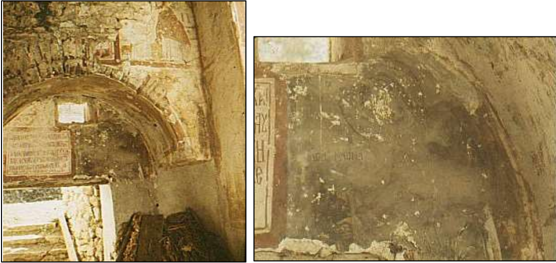
Görsel 7. (solda) Balatlar Kilisesi'nin güney duvarı iç görünümü, 1963 yılı. Kemer yüzeyinde sonradan açılmış pencere açıklığı ve günümüzde yer almayan kitabe görülebilmektedir. (sağda-detay) Azize Marina savaştığı kötü ruhu (Baalzebub?) boğarken görülmektedir.

resmedildiğini söylemek yanlış olmayacaktır. Son dönem kilisesinin etrafında bulunan mezarların 18-20.yüzyıla tarihlendiği düşünüldüğünde, Azize Marina'nın inananların ruhlarını iblislerden, şeytanlardan koruyucu gücüne inanılarak mezar kilisesinin girişinde tasvir edildiği anlaşılmaktadır. Ayrıca ejderhanın içinden zarar görmeden çıkışı 'yeniden doğuşun' sembolü olarak görülmüş ölüm döşeğindeki insanların koruyucu azizesi olarak da değer görmüştür.