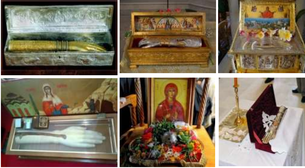
Görsel 2. Antakyalı Azize Marina'ya ait olduğuna inanılan kemik rölikerler.

). 17 Temmuz günü Ortodoks Kilisesi tarafından Şehit Azize Marina yortu günü olarak kabul edilmiştir (Brock, 2008:36). 8