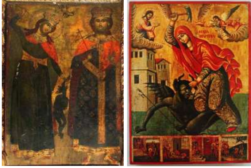
Görsel 6. (Solda) Azize Marina ve Aziz Jovan Vladamir, Saint Naum Manastırı Ohrid, 18.yüzyıl. (sağda) Azize Marina boynuzundan tutmuş olduğu şeytanı öldürürken, 1857, Atina Bizans Müzesi.

Balatlar Kilisesi'nde bulunan duvar resmine benzer örnekler Suriye, Anadolu ve Balkanlarda görülmektedir. Azizenin en çok gösterildiği sahne olan şeytanı boğarken/öldürürken betimlenmiştir. Oldukça tahrip olmuş resimde başı ve boynu kapalı kırmızı maphorion giymiş kadın figürü hafifçe aşağıya eğilirken sol eli hava kalkmıştır. Sağ elinde siyah bir obje görülmektedir. Çizimde daha net olarak görülen azize figürünün başında açık kahverengi hale seçilebilmektedir. Azizenin halesinin daha sonraki dönemlerde açılmış olan pencere açıklığı nedeniyle zarar gördüğü 1963 yılından kalan fotoğraflardan anlaşılmaktadır. Yine aynı fotoğrafta azizenin adının bazı Yunanca harfleri ve resmin alt kısmında bulunan şeytanın (Baalzebub?) siyah yüzü ve gözleri görülmektedir. Balatlar duvar resminde Azize Marina'nın figürün yerleştirilme pozisyonunun farklı olduğu dikkat çekmektedir. Bu farklılığın azize figürünün yanında bulunan diğer figürlerle ilişkisi açısından değerlendirilebileceğini düşündürmektedir. Diğer örneklerde sağ eline aldığı çekiç ile şeytana vurmaktayken Balatlar resim örneğinde sol elini vurmak için kaldırmış olduğu görülmektedir. Figürün bulunduğu kemer alınlığında yer alan onarım kitabesinin yanına yerleştirebilmek için bu şekilde resmedilmenin tercih edildiğini ifade etmek doğru olabilir. Bu şekilde yorumlandığında onarım kitabesinde belirtilen 17.yüzyıl ortalarından daha sonraki bir dönemde Azize Marina'nın duvar yüzeyine