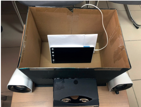
Prototip Olarak Tasarlanan Teknolojik Kutu (içten görünüm)