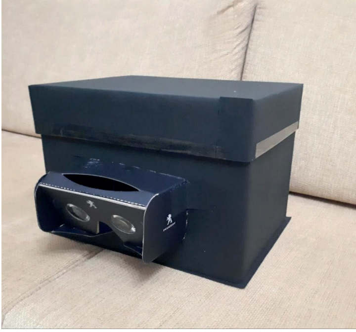
Prototip Olarak Tasarlanan Teknolojik Kutu (dıştan görünüm)