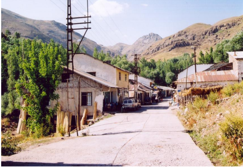
Foto 2: Kiğı'nın ilk kurulduğu Kaleli/Yenişehir mahallesinden bir görünüm.

Kiğı Kasabasının yatay gelişimi, ilk olarak kurumuş olduğu Kerek Deresi vadisinin uzanışına paralel olarak kuzey-güneye doğrultusunda yol ve akarsu boyunca olmuştur. Yerleşim sahası bu vadi doğrultusuna uygun olarak 1930'lu yıllara kadar yavaş ta olsa gelişmiş, konutlar vadi dışına pek taşmamıştır. Ancak bu gelişme doğrultusunda 1930'lu yıllarda merkezden güneye ve kuzeye doğru ilerlemiştir. Bu dönemdeki Kiğı'nın yatay gelişim doğrultusu kabaca kuzey-güney yönünde gerçekleşmiştir.