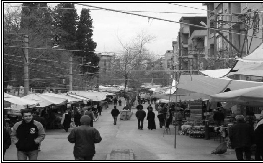
Fotoğraf 2. Yaklaşık 2 km Uzunluğundaki Bursa Yeşilyayla Pazarı'nın Doğu Girişinden Bir Görünüm.

oluşturmaktadır. Pazar kurulan yerlerin çevresinde ikamet edenler okula, işlerine ulaşmakta önemli güçlüklerle karşılaşır. Cenaze vb törenlerini güçlükle yapabilirler, evlilik tarihleri ise pazar kurulmayan bir güne kaydırırlar. Semt sakinleri evlerine girip çıkarken günlük yaşamalarının yanında araçlarını da kullanamazlar. Araçlarını kullanmak isteyenler ise bir gün önceden semt dışındaki alanlara araçlarını park ederler. Küçük yaştaki öğrenciler servis araçlarına uzak mesafelerden binebilirler ve dönüşte yine uzak noktalara bırakılırlar. Pazar günü ise çeşitli tören ve etkinlikler için uygun bir gün olduğundan, Yeşilyayla pazarı çevresinde yaşayanlar ise haftanın tatil gününde adeta ev hapsi cezası yaşarlar.