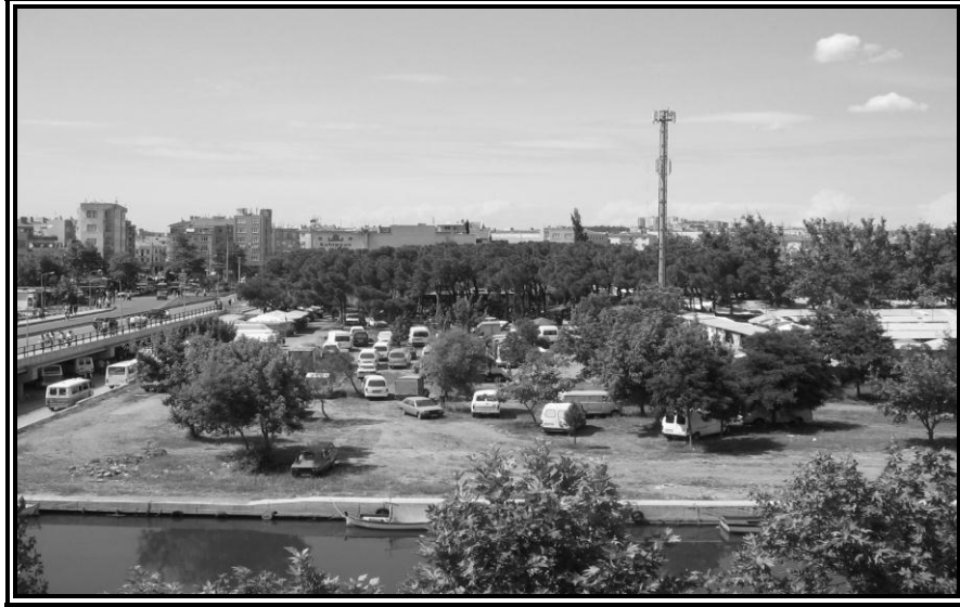
Fotoğraf 3. Cuma Pazarı Çanakkale’de Sarıçay Kenarına Kurulur. Pazar Çevresindeki Yeşil Alanlar Pazar Kurulan Günlerde Otopark Olarak Kullanıldığından Zarar Görmektedir.

etkilerinin daha çok ulaşım ile ilişkili olduğu görülmektedir. Salı Pazarında belirlenen ilk üç sorunun ulaşım ile ilgili olması dikkat çekicidir. Öte yandan müstakil bir alanda kurulan Cuma Pazarının ilk üçe giren sorunundan ikisi ulaşım ile ilgilidir. Cuma Pazarının kent merkezinde çeşitli yönlere dağılan önemli bir kavşak noktası olması ve pazar nedeniyle kendine çektiği yaya ve taşıt trafiğini kaldıracak alt yapıya sahip olmaması nedeniyle bulunduğu alandan çevreye taşan bir etki yapmaktadır. Bu durum pazar yerlerinin sadece müstakil alanlara alınmasının sorunları çözemediğini, kuruluş yeri seçimlerinin çok boyutlu olarak ele alınması gerekliliğini ortaya koymaktadır.