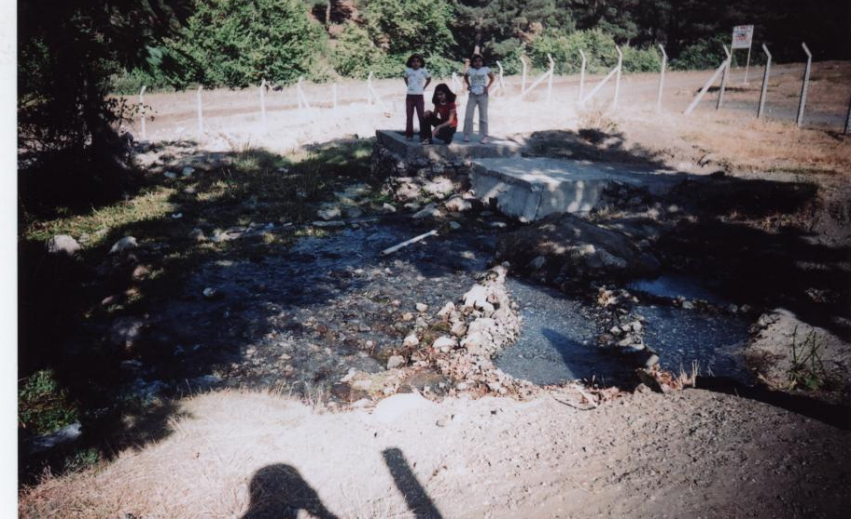
Fotoğraf 1. Yarpuz çayının en büyük kaynağından(Çayın gözü) bir görünüş. Köyün kuruluşunda en belirleyici unsurlardan biridir.

Yayla yerleşmelerinin dağınık oluşunun ve farklı yükseltilerde yer almış olmasının bir başka nedeni de bölgede yaşayan nüfusun önceleri, yerleşik hayata geçerek ekip-biçme faaliyetleri yapmaları yanında büyük ölçüde hayvancılıkla (küçükbaş) uğraşmış olmalarıdır. Yaptığımız anketlere göre Osmaniye il merkezi ve çevresinde Nur Dağları ile Çukurova'nın birleştiği kesimler (daha çok vadiler) kışlak olarak kullanılıyordu. İlkbahar mevsiminin ilk aylarıyla birlikte, otlakların yeşermesine paralel olarak burada yaşayan nüfus, hayvanlarını otlatmak için daha yüksek kademelere çıkıyorlar, belli bir süre (25-30 gün) burada kalarak hayvanlarını otlattıktan sonra daha üst kademelerdeki, yaylalara hareket ederek Nur Dağları'nın 1500-1600 m. yükseklerinde yer alan otlaklara kadar (Göksu, Soğukoluk yaylası) çıktıkları bilinmektedir. Ağustos ayı sonlarından itibaren ise tekrar aşağı seviyelerde bulunan yaylalarda yine belirli süreler kalarak ekim-kasım aylarında Çukurova'ya iniliyordu. Günümüzde, hayvancılık faaliyetinin yapılmadığı söz konusu yayla yerleşmelerinin farklı yükseltilerde ve dağınık bir şekilde yer almış olmasının bir nedeni de bu olsa gerekir.