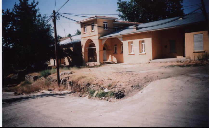
Fotoğraf 2. Yarpuz köyünde hükümet konağından bir görünüş. Köy 1864 e kadar sancak merkeziydi(Cebel-i Bereket).