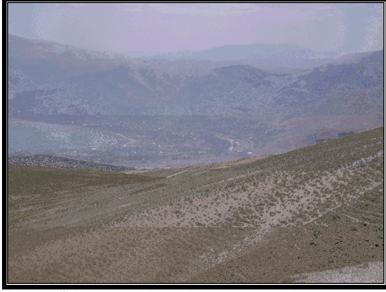
Foto 3. Tatvan Şehri'nin kuzeyde yer alan Yumurta Tepe'den Görünüşü ve şehrin güney ve batısında yer alan yüksek alanlar (2008).

olmak üzere, İşletme ve Karataş mahalleri doğrultusunda yaklaşık olarak 1 km. (Harita 2 E-F)dir.