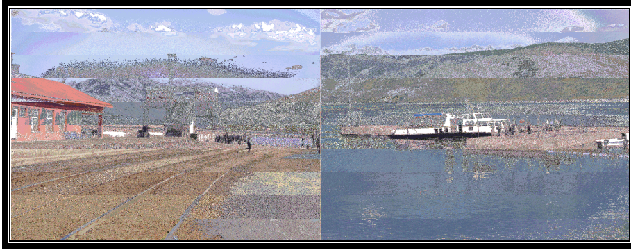
Foto 4. Tatvan'da feribot seferlerinin yapıldığı liman ve yolcu rıhtımı (2008).

sağlanmıştır (Foto 4). Bu nedenle Tatvan şehri coğrafi konum sınıflandırmasına göre; önemli kara, demiryolu ve su yollarının birleştiği ve bir limanın bulunduğu Tatvan koyu kenarında yer alan bir şehir özelliği taşımaktadır (Harita 1).