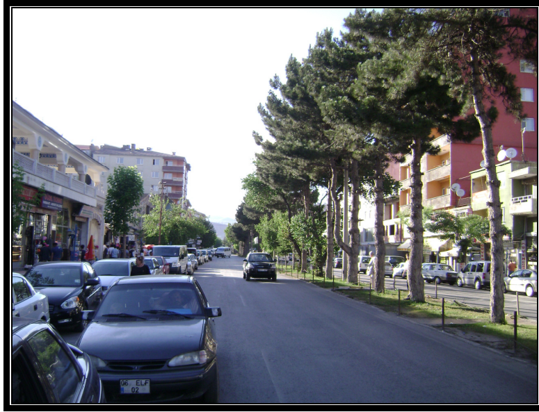
Foto 2. Önemli iş yerlerinin yer aldığı Cumhuriyet Caddesi'nden bir görünüş (2008)

Van Gölü'nün batı kıyısında yer alan Tatvan, daha batıda yer alan Güneydoğu Toros Dağları'yla çevrilmiştir. Tatvan'ı batıdan çevreleyen bu uzantılar içinde en önemli yükseltiler Tuğ, Seyran, Taşlı ve Hanun tepeleridir. Bu tepelerin daha gerisinde batıda Sikirinkuz (2559 m.), güneyde Sengesor (2295 m.), güneydoğuda Sirman Tepe (2058 m.) gibi tepelerin bulunduğu daha yüksek bir alan bulunmaktadır. Yine şehrin kuzeyinde yer alan volkanik Nemrut Dağı da şehri sınırlayan önemli fiziki faktörlerdendir. Şehir, önemli işyerlerinin yer aldığı ve kabaca güneydoğu-kuzeybatı istikametinde uzanan Cumhuriyet Caddesi(Foto 2) ile güneybatı-kuzeydoğu istikametinde uzanan Ahlat yolu boyunca uzanmıştır. Bu nedenle şehir, Tatvan koyu etrafında Van Gölü ile bahsedilen dağlık alanda sıkışıp kalmış ve kıyı boyunca gelişme göstermiştir (Harita 1, Foto 1-3). Doğal ortamın hazırlamış olduğu bu şartlar sonucunda, her ne kadar şehir aynı doğrultuda devam eden ince uzun ve hilale benzer bir şekle sahipse de, genel itibariyle en ve boyunun uzunluğu dikkate alındığında, ince ve uzun bir şekle sahip olduğu görülmektedir.