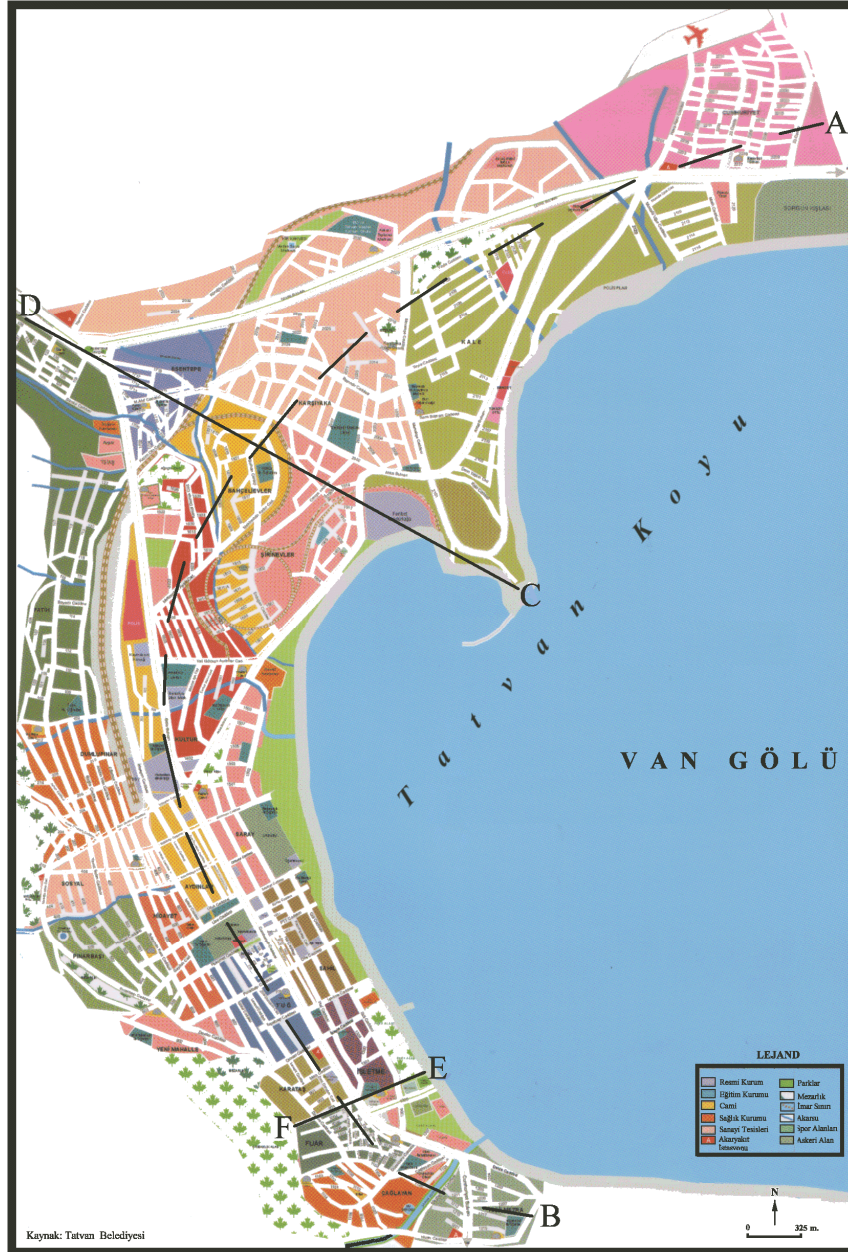
Harita 2. Tatvan Şehir Planı (2006)