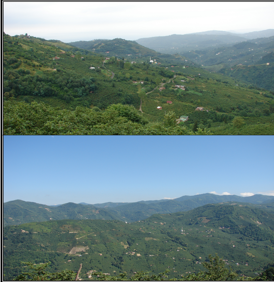
Fotoğraf 1. Yeşilyurt Köyü’nden Kuzey (üstteki) ve Kuzeydoğuya Doğru Görünümler.

Türkiye’de kırsal kesimden şehirlere yönelik hızlı bir göç hareketi olduğu bilinmektedir. Bu bağlamda, kırsal nüfusun şehir ve şehir yaşamına ilişkin görüşleri önem taşımaktadır. Bu çalışmada kırsal nüfusun şehir algısı, Trabzon’un merkeze bağlı Yeşilyurt köyünden seçilen örneklem ile ortaya konmaya çalışılmıştır. Böylece ülkemizde kırsal kesimden şehre yönelik göçlerin sebepleri ve kırsal nüfusun zihin haritasında (Tümertekin-Özgüç, 1998: 65-66) şehir algıları hakkında önemli bulgulara ulaşılabileceği düşünülmüştür. Yeşilyurt köyünün örneklem olarak seçilmesinde, şehirle etkileşim düzeyinin yüksek olmasına bağlı olarak, şehir algılarının farklılık göstereceği öngörüsü etkili olmuştur. Araştırma betimsel bir çalışma olup, veri toplamak üzere 14 sorudan oluşan anket formu 184 kişiye uygulanmış ve veriler SPSS’de analiz edilmiştir. Elde edilen bulgular tablolaştırılarak yorumlanmaya çalışılmıştır.