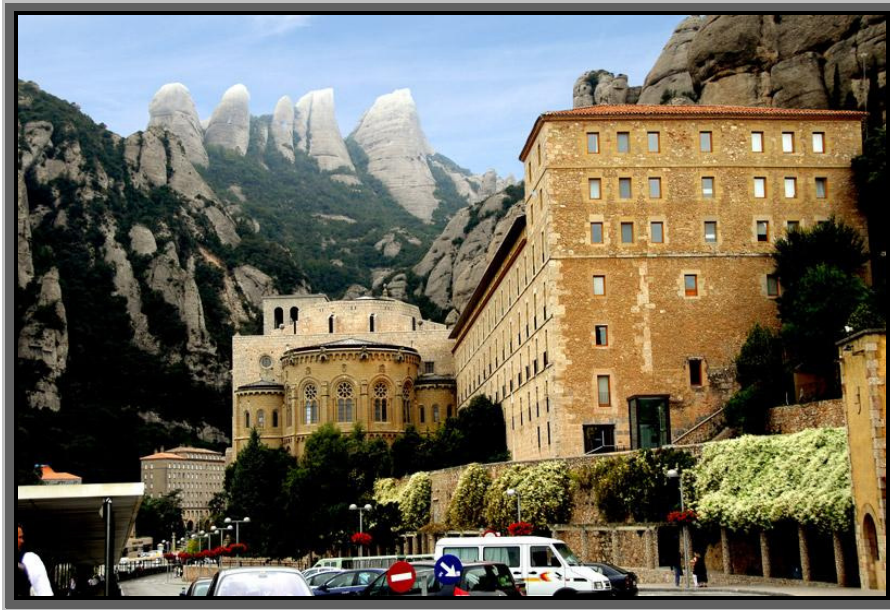
Foto 1. Barselona'da Turistik Bir Mekân.

İspanya ekonomisinde turizm gelirleri GSYİH içinde %12 gibi küçümsenmeyecek bir değere sahiptir. ABD.'den sonra dünya sıralamasında, turistlerin en çok ziyaret ettikleri ve turizmden en çok gelir elde eden ikinci ülkedir. İspanya'ya 1996 yılında 41 milyon turist 20 gelirken, bu rakam 2003 yılında 52 milyona çıkmıştır. 2004 yılında dünyada turizmden yaklaşık olarak, 575 milyar dolarlık gelir elde edilirken, İspanya'nın payı %8 olmuş ve yaklaşık olarak 42 milyar dolarlık bir gelir elde etmiştir. İspanya'nın turizmde elde ettiği başarı ve milli gelir içindeki payı aynı zamanda İspanya'yı özellikle terör konusunda oldukça duyarlı hale getirmiştir. İspanya'nın etnik parçalanmışlığı ve ülkeyi bölme eğilimde olan terör örgütlerinin bulunması, turistlerin terör eylemlerine karşı çabuk tepki göstererek, ülkeyi terk etmesi, İspanya'nın dış ilişkiler konusunda daha hassas davranmasına yol açmaktadır. Bu nedenle İspanya'da 11 Mart 2004'te Madrid'te patlayan bombalar ülkede üç gün sonra yapılan genel seçimlerin yönünü değiştirerek Jose Maria Aznar'ın seçimi kaybetmesine ve bugünkü Başbakan Zapatero'nun kazanmasına yol açmıştır. Hükümet değişikliğinin ardından ilk iş İspanyol askerler Irak'tan çekilmiş ve Türkiye ile birlikte "Medeniyetlerin Bütünleşmesi" çalışmalarına başlanmıştır.