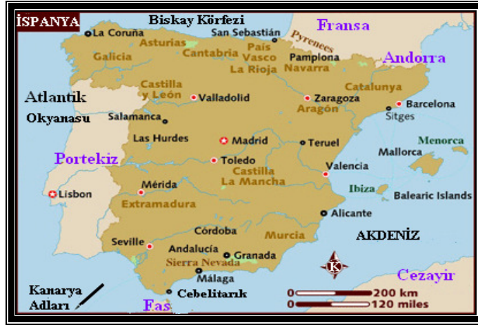
Şekil 2. İspanya'da Önemli Kent Yerleşmelerinin Dağılımı

%17'sini barındırmaktadır. Bölgenin bu özelliğinin tek istisnası, siyasi nedenlerle ülkenin merkezine inşa edilmiş olan Madrid ve çevresidir. Bu bölge, kilometrekareye 625 kişi ile ülkede nüfusun en yoğun olduğu yerdir.