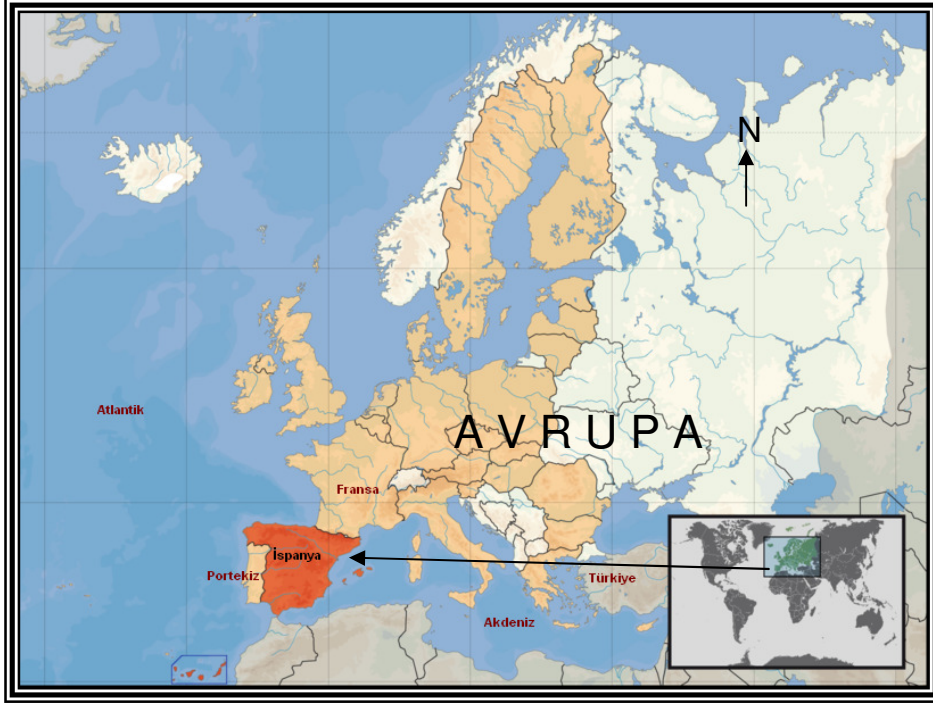
Şekil 1. İspanya'nın Lokasyon Haritası

yapıları tarihsel süreç içinde bünyesinde barındırması, İspanya'ya hem sorun oluşturmuş hem de ekonomik ve toplumsal gelişimine katkı sağlamıştır.