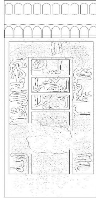
Çizim No: 2- K-6 2668 No.lu Mezar Taşının