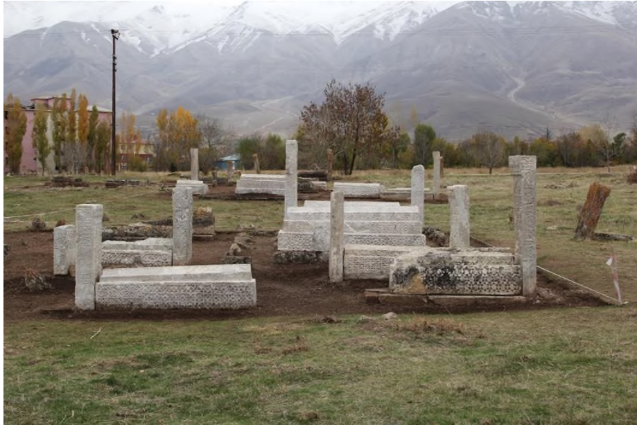
Fotoğraf No 8: Gevaş Selçuklu Mezarlığı (Gevaş Selçuklu Mezarlığı Kazı Arşivinden Alınmıştır).

Dikdörtgen bir forma sahip olan eserin baş şahidesinin uzunluğu 175 cm, genişliği 57 cm, kalınlığı ise 23 cm ölçülerindedir. Eser mezarlıktaki şahideler içerisinde orta büyüklükte olarak kabul edilebilir. Ölçü olarak genellikle düzgün bir grafik çizen şahideler, XII. yy'ın son çeyreğinden XIV. yy'ın son çeyreğine kadar boyut olarak yükselmiş ve bu yükseliş, sonrasında şahidelerin daha ince uzun bir