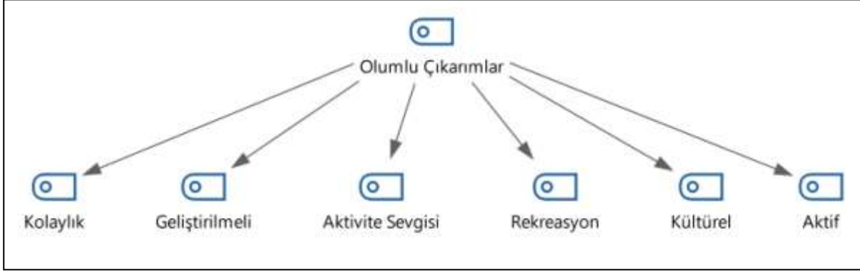
Çizelge 1: Olumlu Çıkarımlar Temasına ait Katılımcı Görüşü Yüzdeleri