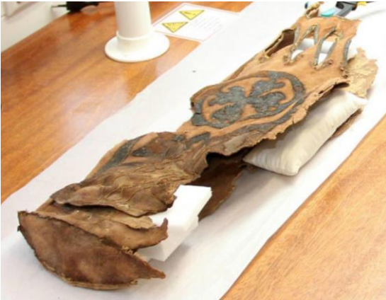
Şekil 3. 1300 Yıllık Türk Alp'ine Ait Tırkeş (Ok Taşıma Çantası) ( http://www.lisa.gerda-henkel-stiftung.de , 2016)