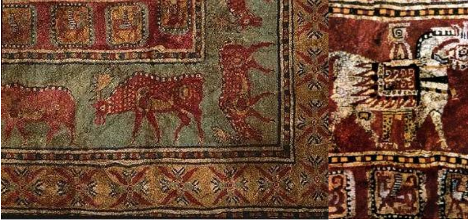
Şekil 4. Pazırık Kurganında Bulunan Halıdan İki Ayrıntı

Türkler kurdukları devletler ve medeniyetleri yoluyla günümüze değin pek çok sanat eseri üretmiştir. Türklerin benimsedikleri göçebe yaşam tarzı, ortaya koydukları bu sanat eserlerine de yansımıştır. Bazen, bir seramik, bazen bir kumaş parçası bazen de mimari bir eserde at, keçi, aslan figürleri görülürken bazen de bir savaş sahnesi işlenmiş minyatürler göçebe kültürünü anlamamıza yardımcı olur. Orta Asya'da yaşayan Türkler için hayvan öğelerini kullanmak çok önemlidir (Şekil 4). Hayvan figürleri bu toplumlar için kahramanlık, kuvvet, bereket, mertlik ve bağlılık gibi duyguları çağırıştırır. Bu dönemlerde mevsim göçleri, avlanma, komşu sınırlarını aşma ve hızla yer değiştirme nedeniyle at biniciliği yaygın bir hal almıştır. Bazı tarih yazarları Hunların at sırtında alışveriş yaptıklarını, yemek yediklerini ve hatta uyduklarını yazar. Ata olan bu bağlılık ona olan sevgiyi yüceltmiş, bakımı ve süslenmesi Türk'ün değişmez bir geleneği olmuştur. Atın koşum takımları ve eğeri süslenirken bozkırda karşılaşılan vahşi hayvanların birbiriyle savaşı konu alınmış ve bu figürler diğer kullanım eşyalarının süslenmesinde de kullanılmıştır(Kılıçkan, 2004, s.45).