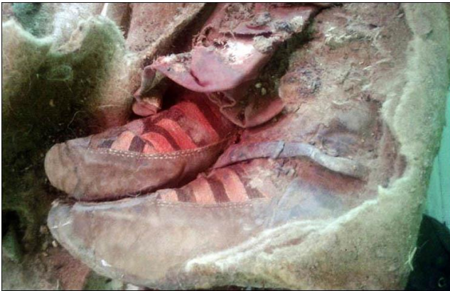
Şekil 5. Moğolistan'da Bulunan 1500 Yıllık Kadın Mumyasının Çizmesi ( http://arkeofili.com/?p=13080 , 2016)

Türkler kurdukları devletler ve medeniyetleri yoluyla günümüze değin pek çok sanat eseri üretmiştir. Türklerin benimsedikleri göçebe yaşam tarzı, ortaya koydukları bu sanat eserlerine de yansımıştır. Bazen, bir seramik, bazen bir kumaş parçası bazen de mimari bir eserde at, keçi, aslan figürleri görülürken bazen de bir savaş sahnesi işlenmiş minyatürler göçebe kültürünü anlamamıza yardımcı olur. Orta Asya'da yaşayan Türkler için hayvan öğelerini kullanmak çok önemlidir (Şekil 4). Hayvan figürleri bu toplumlar için kahramanlık, kuvvet, bereket, mertlik ve bağlılık gibi duyguları çağırıştırır. Bu dönemlerde mevsim göçleri, avlanma, komşu sınırlarını aşma ve hızla yer değiştirme nedeniyle at biniciliği yaygın bir hal almıştır. Bazı tarih yazarları Hunların at sırtında alışveriş yaptıklarını, yemek yediklerini ve hatta uyduklarını yazar. Ata olan bu bağlılık ona olan sevgiyi yüceltmiş, bakımı ve süslenmesi Türk'ün değişmez bir geleneği olmuştur. Atın koşum takımları ve eğeri süslenirken bozkırda karşılaşılan vahşi hayvanların birbiriyle savaşı konu alınmış ve bu figürler diğer kullanım eşyalarının süslenmesinde de kullanılmıştır(Kılıçkan, 2004, s.45).