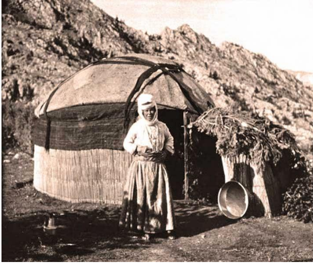
Şekil 6. Keçi Kılı Yörük Çadırı

Yörükler, göçebe Türk kültürüne uygun yaşantılarını diğer birçok Türk topluluğuna göre daha uzun süre devam ettiren ve yerleşik düzene yakın zamanlarda geçen (az da olsa devam ettirenler vardır) Türk topluluklarından birisidir(Demir ve Bakar, 2014, s.111). Mevsimlere bağlı değişen olumsuz hava koşullarından korunmak ve sürüleri için yeni otlakların bulunması amacıyla sürekli yer değiştiren Yörükler, barınma ihtiyaçlarını keçi kılından dokudukları çadırlar ile karşılamıştır (Şekil 6). Çadırların içindeki toprak zeminin neminden ve soğuktan korunmak için ise halı dokumacılığı önem kazanmıştır. Bu nedenle Yörük sanatına dair en yoğun örnekler dokuma halı, kumaş, vb. eşyalarda karşımıza çıkmaktadır.