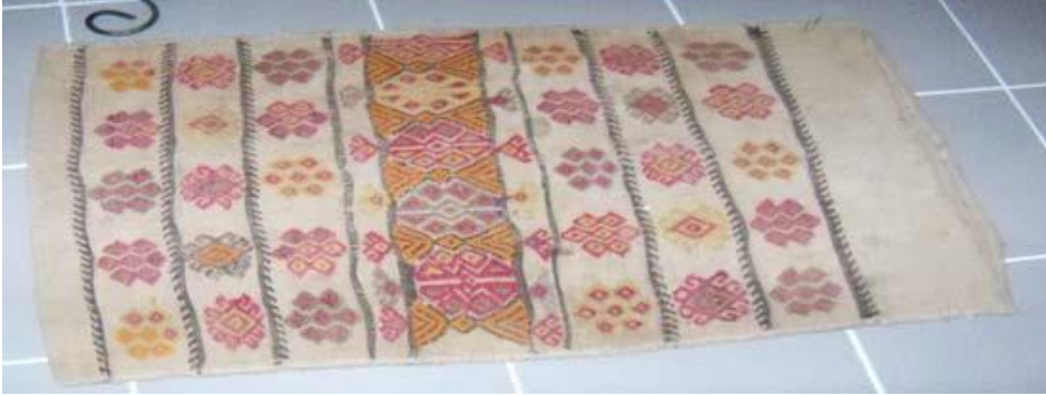
Şekil 8. Beykonak Yöresi Düz Dokuma Çuval Örneği (Yıldırım, 2013,s.209)

Yörüklerin ortaya koyduğu eserlerdeki motiflerde hayvan figürlerinin yanı sıra, geometrik ve stilize bitki motiflerine de sıkça rastlanmaktadır. Genellikle Yörük motiflerinin her biri bir isim ve anlama da sahiptir. Bu motifler, ait oldukları Yörük boylarının tamgalarını yahut günlük yaşantıları içindeki nesne ve olayları, inanışları ve mitleri ifade etmede kullanılan bir tür sembolik anlatım ve iletişim unsurlarıdır. Örneğin Şekil 8’de yer alan örnekte tekrar edilen motifler “bereket”, “kurbacık”, “çakmak”, “tarak” gibi isimler ile farklı kompozisyonlarda kullanılmıştır.