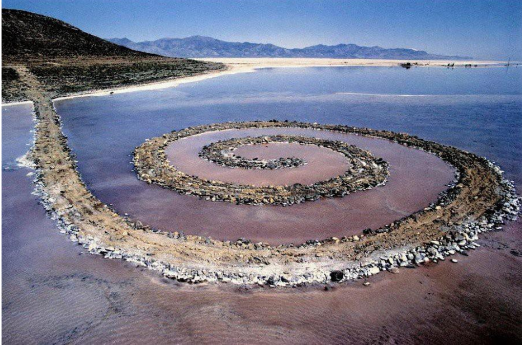
Görsel 1. Robert Smithson, Spiral Dalgakıran , 1970, kireçtaşı, toprak, su, U. 147,2m., G. 4,57m., Büyük Tuz Gölü, Utah.

Küresel ısınma sebebiyle buzulların erimesi sonucu doğal dengenin bozulmasına ilgi çekmek isteyen Andy Goldsworthy, Olafur Eliasson'un ve Marco Evarissti bu alanda çalışmalar üretmişlerdir. Evarissti 2004 yılında Grönland'da bir buzdağının tamamını spreyle kırmızıya boyayarak toprak sınırları ve çevre kirliliğine dikkat çekmek istedi. (Görsel 2)