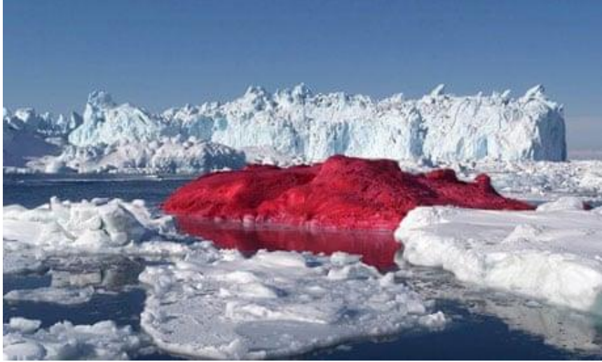
Görsel 2. Marco Evarissti, ' Ice Cube Project ', 2004, buz ve 3000 litre kan kırmızısı boya, Grönland.

Küresel ısınma sebebiyle buzulların erimesi sonucu doğal dengenin bozulmasına ilgi çekmek isteyen Andy Goldsworthy, Olafur Eliasson'un ve Marco Evarissti bu alanda çalışmalar üretmişlerdir. Evarissti 2004 yılında Grönland'da bir buzdağının tamamını spreyle kırmızıya boyayarak toprak sınırları ve çevre kirliliğine dikkat çekmek istedi. (Görsel 2)