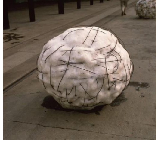
Görsel5. A Goldworthy, 2000, Kar Topları , Londra.