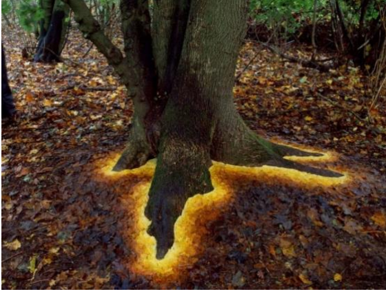
Görsel 4. A. Goldworthy, Çınar ağacı , 2013, Hampshire.