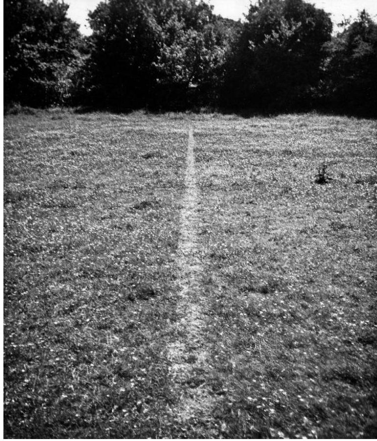
Görsel 6. Richard Long, Yürüyerek Yapılmış Çizgi , 1967, İngiltere.

Çevreci Sanat adı altında en önemli isimlerden Christo ve eşi Jeanne Claude 1960 lardan beri gerçekleştirdikleri dev eserler ile çevrelerini etkilemiş, insan algısını değiştirmiş dönüştürmüşler. Dünyanın bir çok ülkesinde doğaya olan duyarlılıklarını insanlarla paylaşmak için eserler üretmişlerdir. Bunlardan bir tanesi de göl sularının çekilmesi ve su kirliliği üzerine dikkat çekmek amacı ile yaptıkları The Surrounded Islands çalışmasıdır.