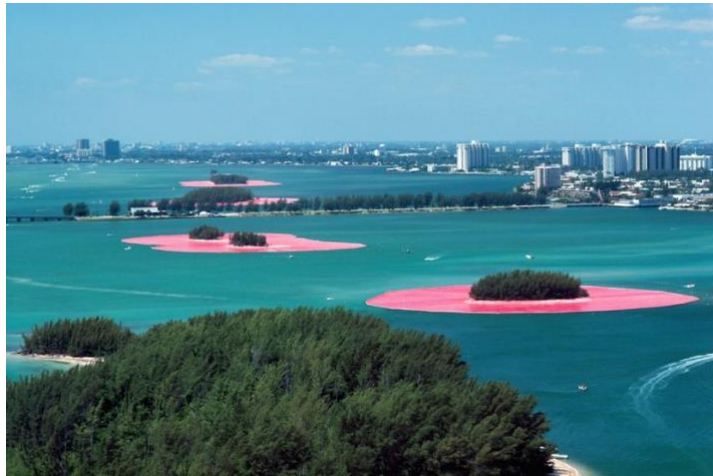
Görsel 7. Christo-Jeanne Clude, Çevreleyen Adalar , 1983, Florida.

Çevreci Sanat adı altında en önemli isimlerden Christo ve eşi Jeanne Claude 1960 lardan beri gerçekleştirdikleri dev eserler ile çevrelerini etkilemiş, insan algısını değiştirmiş dönüştürmüşler. Dünyanın bir çok ülkesinde doğaya olan duyarlılıklarını insanlarla paylaşmak için eserler üretmişlerdir. Bunlardan bir tanesi de göl sularının çekilmesi ve su kirliliği üzerine dikkat çekmek amacı ile yaptıkları The Surrounded Islands çalışmasıdır.