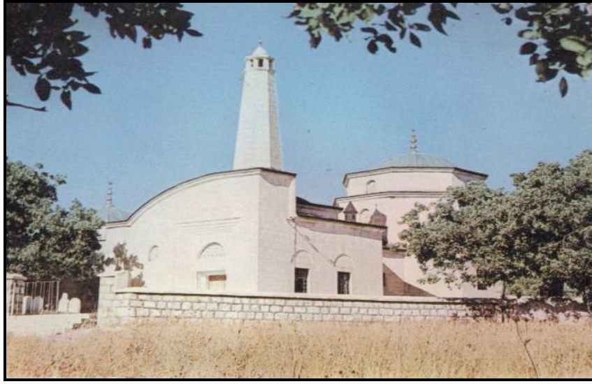
Foto 2: İbrahim Hakkı ve İsmail Fakirullah’a ait türbelerin yer aldığı “Işık Hadisesi” adlı yapıt

Fakirullah için Tillo'da yaptırdığı türbeye defnedilmiştir. İbrahim Hakkı 1753 yılında takvim işlevi gören “Devr-i Daim” denen bir araç yapmıştır. Diğer eserlerinden Saatname ve İhtiyarat’ül Kamer gezegenler ve takvimlerle ilgili bilgileri içerir. Rub’ul Mueyyeb, yeryüzünün enlem ve boylamlarının nasıl bulunacağını, yön tayininin nasıl yapılacağını anlatmaktadır (Siirt, 2007:251).