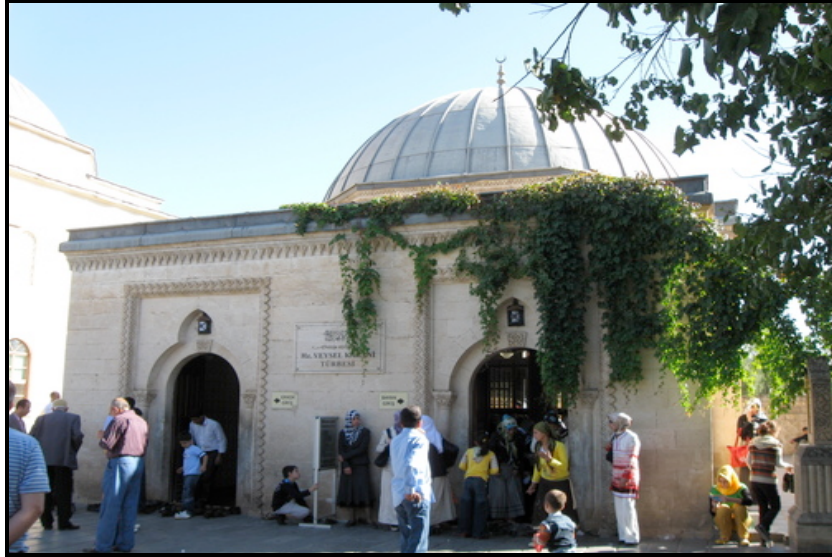
Foto 1. Veysel Karani türbesi.