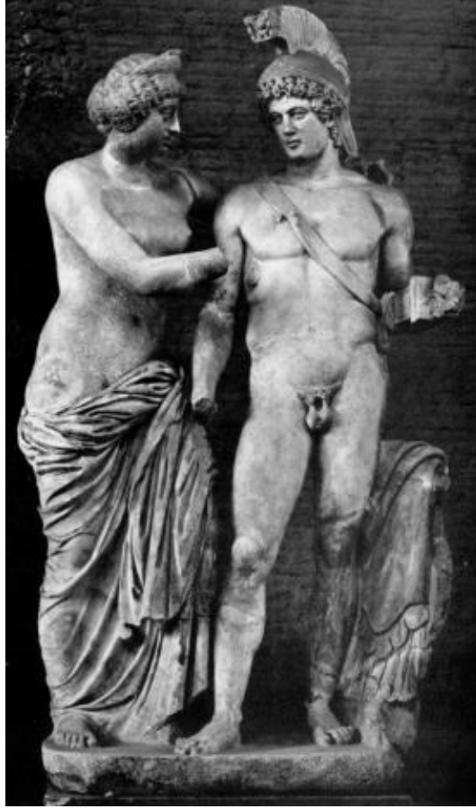
Res. 3: Terme Müzesi Mars ve Venüs Heykel Grubu (Kleiner 1981, pl. XXVII, fig. 10)