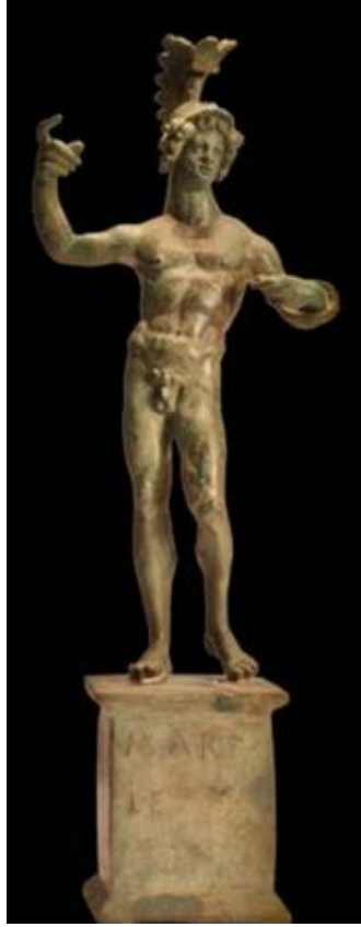
Res. 5: Hatay Arkeoloji Müzesi Mars Heykeli ( https://sanalmuze.gov.tr/muzeler/HATAY_ARKEOLOJİ_MUZESİ )