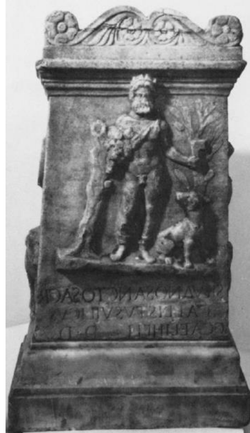
Res. 6-7: Mars Silvanus (Palmer 1978, 227, fig. 1-2).