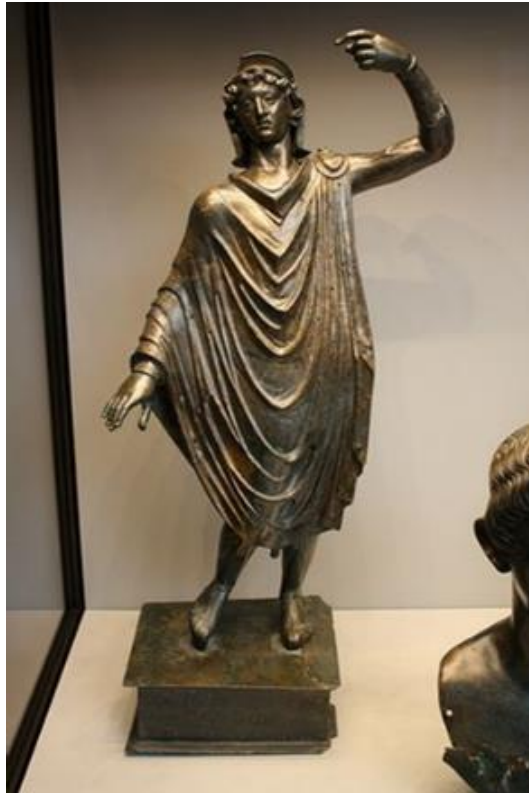
Res. 4: Mars Cohanus ( https://www.getty.edu/art/collection/object/10402K )