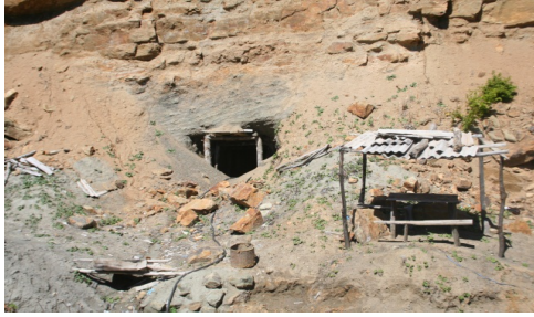
Foto 1. Tkibuli'deki Maden Galerinden Biri.