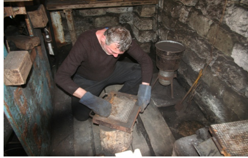
Foto 4. Atölyede Döküm İşlemi.