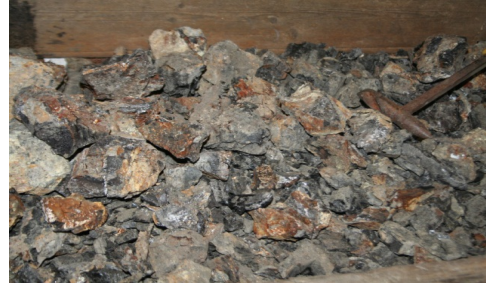
Foto 2. Ham haldeki Gürcistan Kehribarının