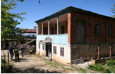
Foto 3. Tkibuli'deki Atölyelerden Bir Görünüm.

Gürcistan'da madenlerin çıkarımının ve işleminin yapıldığı Tkibuli kasabası ve yine işleme tesislerinin bulunduğu Kutaisi kentine yaptığımız arazi uygulama çalışmalarında atölye yetkilileri; Gürcistan kehribarının çok yumuşak olduğunu, doğrudan hediyeleş eşya yapılamadığını ve yapılması durumunda ise kısa sürede çatladığı, dolayısıyla doğrudan işlemede kullanılmadığını belirtmişlerdir. Çeşitli boyutlarda ham halde çıkarılan taşlar atölyelerde öncelikle öğütülerek toz hale getirilip, yapıştırıcı maddelerle karıştırılarak sıvı hale getirilmektedir. Sonrasında sıvı haldeki malzeme kalıplara döküm yapılarak preslenmekte ve tespih taneleri yapılmaktadır. Elde edilen taneler makineler aracılığıyla delinerek zımparalanmakta ve tespih yapılmaktadır.