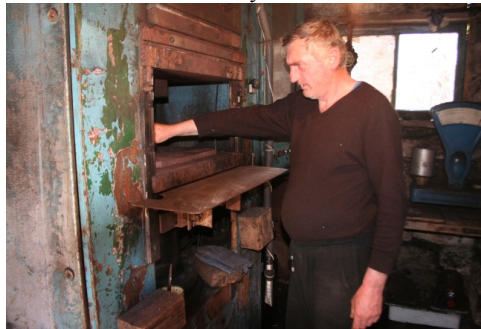
Foto 3. Atölyede Presleme Makinesi.