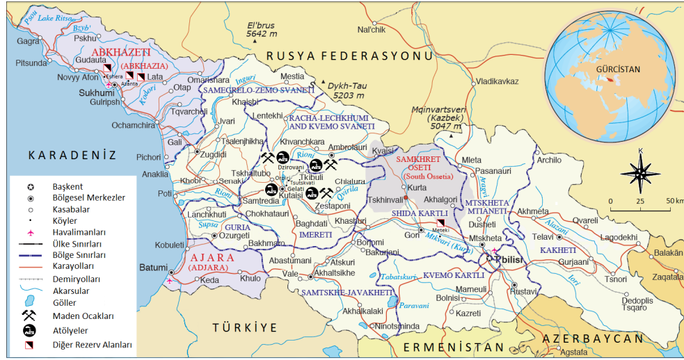
Harita 1. Gürcistan'ın Coğrafi Konumu ve Siyah Kehribar Üretim Alanları.