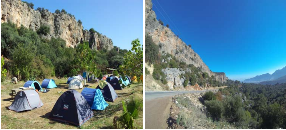
Resim 1. Geyikbayırından Görünüm

Geyikbayırı, kaya tırmanışı açısından; 2000 yılında keşfedilmiş bir bölgedir. Bölgede 2000-2002 yılları arasında yaklaşık 30 kaya tırmanış rotası açılmıştır. 2002 yılında Klettern dergisinde (Avrupa da yayımlanan tırmanış ve doğa sporları magazini) bölgenin tanıtılması, tırmanış camiasının dikkatini bölgeye çekerek, bölgenin kaya tırmanışı anlamında tanınmasına önemli düzeyde destek olmuştur. Bu dönemden sonra bölgeye çok sayıda tırmanışçı gelmeye başlamıştır. Bu durumla orantılı olarak bölgedeki kaya tırmanış rotalarının sayısında da artış gerçekleşmiştir (Kayıkçı 2009).