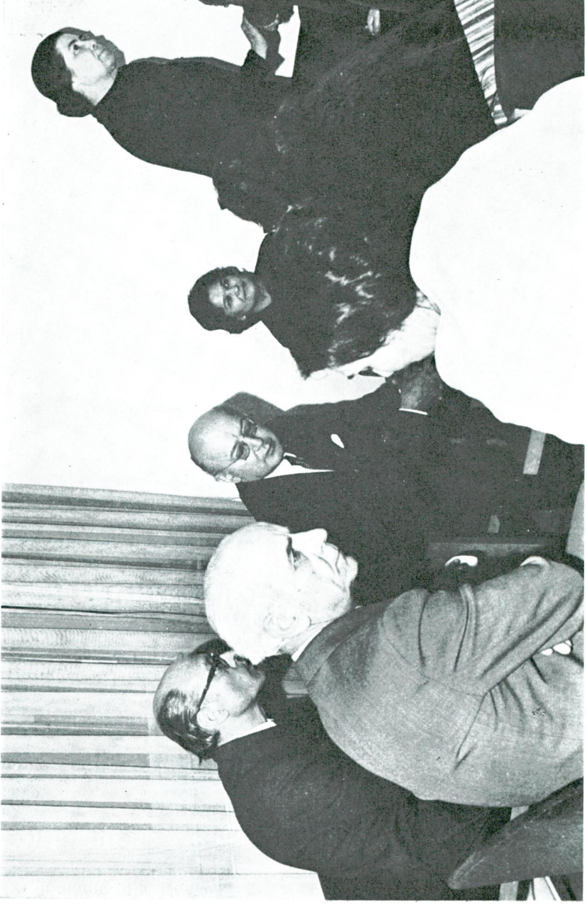
Türk Tarih Kurumu'nun 40. yıldönümü töreni dolayısıyla verilen kokteylde Başbakan Prof. Dr. Nihat Erim, Adalet Bakanı İsmail Arar ve Millî Eğitim Bakanı Şinasi Örel Kurum Üyeleriyle.