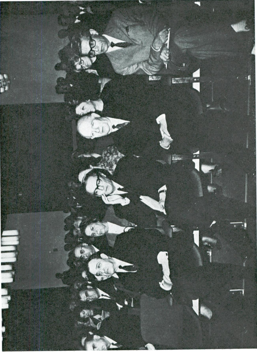
Türk Tarih Kurumu'nun 40. yıldönümü törenini izleyen davetliler.