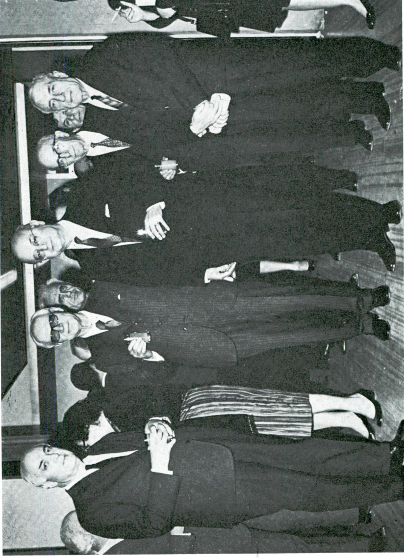
40. yıldönümü Kokteylinde Sayın Başbakan Prof. Dr. Nihat Erim Kurum Başkanı ve Konuklarla bir arada.