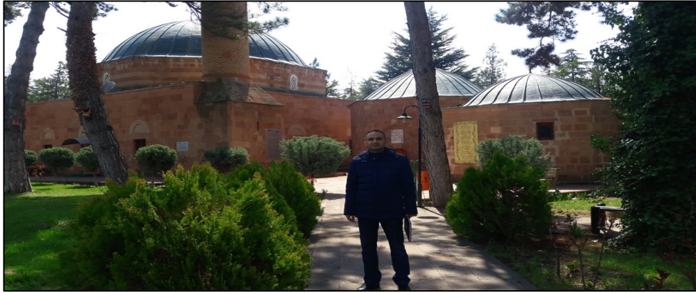
Fotoğraf 1: Hasan Dede Camii, Hasan Dede Türbesi ve Hasan Dede'nin evlatlarının medfun olduğu türbe