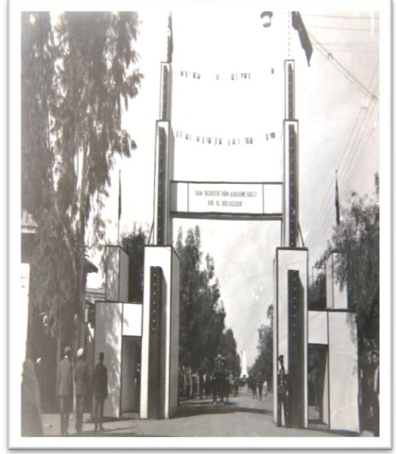
Görsel-14: Türk Tacirleri Grubu takı