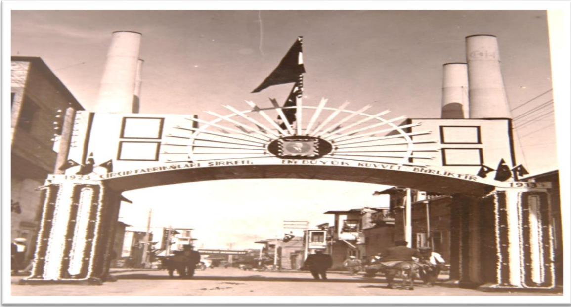
Görsel-10: Çırçır Fabrikaları Şirketi takı