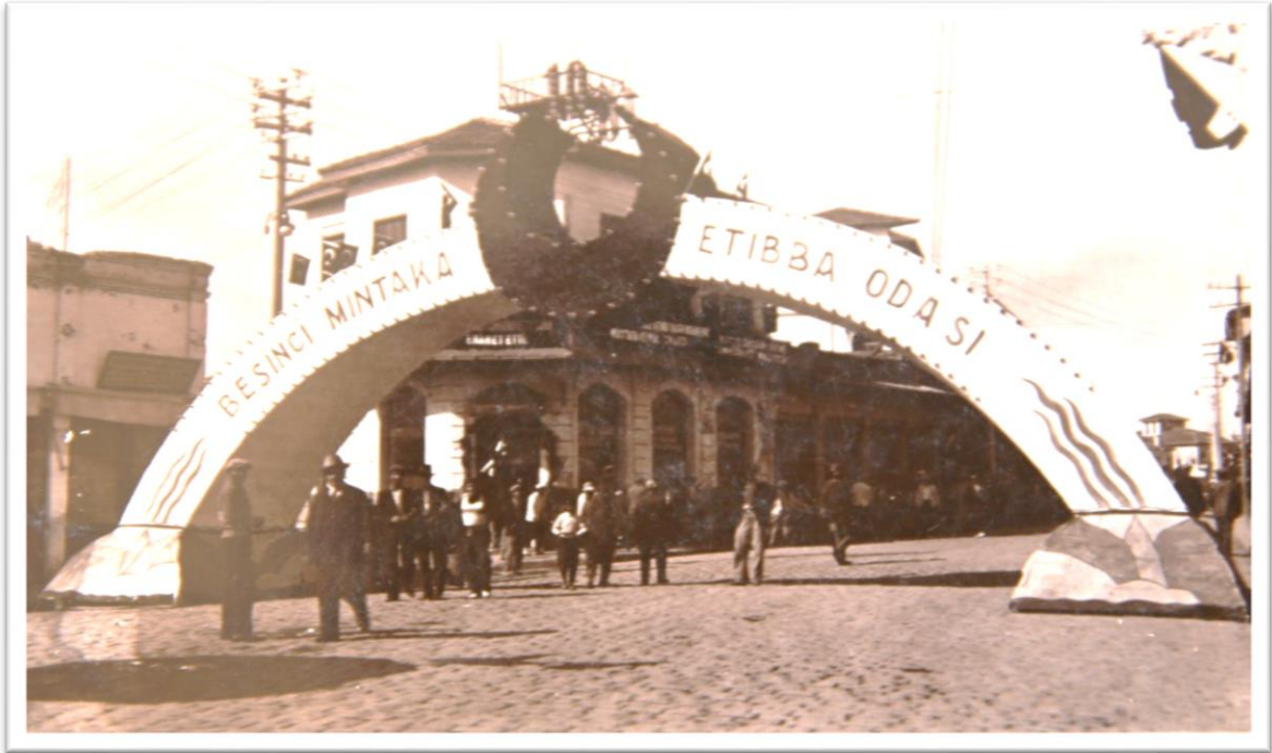
Görsel-2: Tabipler Odası takı

Kentte kurulan zafer taklarından öne çıkan kuruluş “Etibba Odası” [Tabipler Odası] tarafından yapılandı. Etibba odaları “11 Nisan 1928 tarih ve 1219 Sayılı Kanun’a” göre kurulmuş kurumlardı. Adana Tabipler Odası ise ilk yapılanmasını “Beşinci Mıntıka Etibba Odası” olarak kurmuştu (“Tababet ve Şuabatı Sanatlarının Tarzı İcrasına Dair Kanun”, Cilt:3, Birleşim: 57, 11 Nisan 1928: 63–67). Adı geçen bu oda Cumhuriyetin onuncu yılı münasebetiyle zafer takı yaptırmak istedi. Oval formda ve üst kemerin birleştiği yerde ay-yıldız kaidesinin yer aldığı ışıklı bir tak yaptırdı. Üzerinde “10” yazan renkli tak şehrin işlek caddelerinde birine yerleştirildi. Beşinci Mıntıka Etibba Odası’nın Adana kentinde Yağ Camii civarında (Türk Sözü, 22 Ekim 1933: 1-3) yaptırdığı tak şu şekildeydi (Adana Alparslan Türkeş Bilim ve Teknoloji Üniversitesi Kütüphane Dokümantasyon Daire Başkanlığı Arşivi, Görsel No:2, 1933):