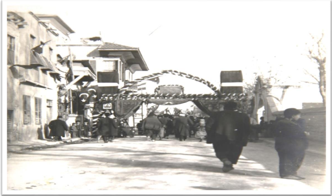
Görsel-15: Arap harfli tak