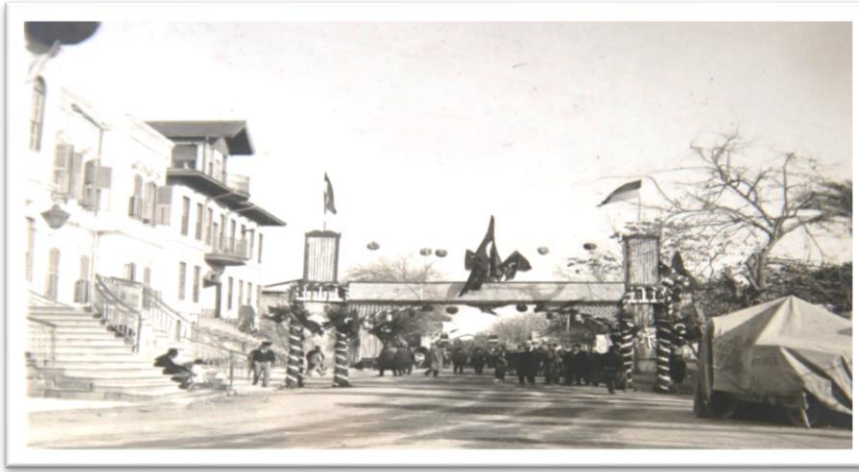
Görsel-1: Memur takı

Yapılan takların sayısı kent genelinde 40 civarındaydı. Büyüklükleri değişiyordu. Genel itibarıyla caddenin iki kenarına ortalanarak takların altından insanlar, atlı arabalar veya araçlar geçebilecek şekilde inşa edilmişti. Oval, kare, dikdörtgen, üçgen formlar öne çıkıyordu. Tek katlı yapıların yanında dört kata kadar ulaşabilen çok katlı/çift taraflı formlar da mevcuttu. Çok uzun süre dayanacak malzemelerden yapılmamışlardı. Genellikle ahşap, sağlam ağaç kazıklı, kontrplak, bez, ağaç dalı, çiçek, yaprak veya saç kaplama malzemelerindendi. Verilmek istenen mesaj çoğunda aynıydı. Bunlar içerisinde “1923-1933”, “10. Yıl”, “Altı Ok veya Oklar”, “Tarım Ürünleri (Özellikle Buğday-Pamuk)”, “Fabrika veya Fabrika Bacaları”, “Ay-Yıldız Form” ve takları süsleme amaçlı çeşitli yerlerinde asılı “Türk Bayrağı” ortak mesajlardı. Bağımsızlık, millilik, üretim, devlet-millet el ele duruşu ve Cumhuriyetin kazanımları 5 vurgulanıyordu. Ayrıca çoğunda gece ışıklandırması ortak özellikti. Adana’da memur komisyonu tarafından hazırlanan ve Halk Fırkası yanı Adli İhtisas Binası önünde kurulan (Türk Sözü, 22 Ekim 1933: 1) zafer takı şu şekildeydi (Adana Alparslan Türkeş Bilim ve Teknoloji Üniversitesi Kütüphane Dokümantaston Daire Başkanlığı Arşivi, Görsel No:1, 1933):