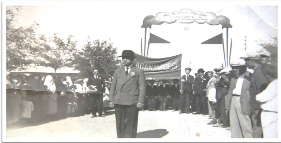
Görsel-8: Millî Mensucat Fabrikası taki