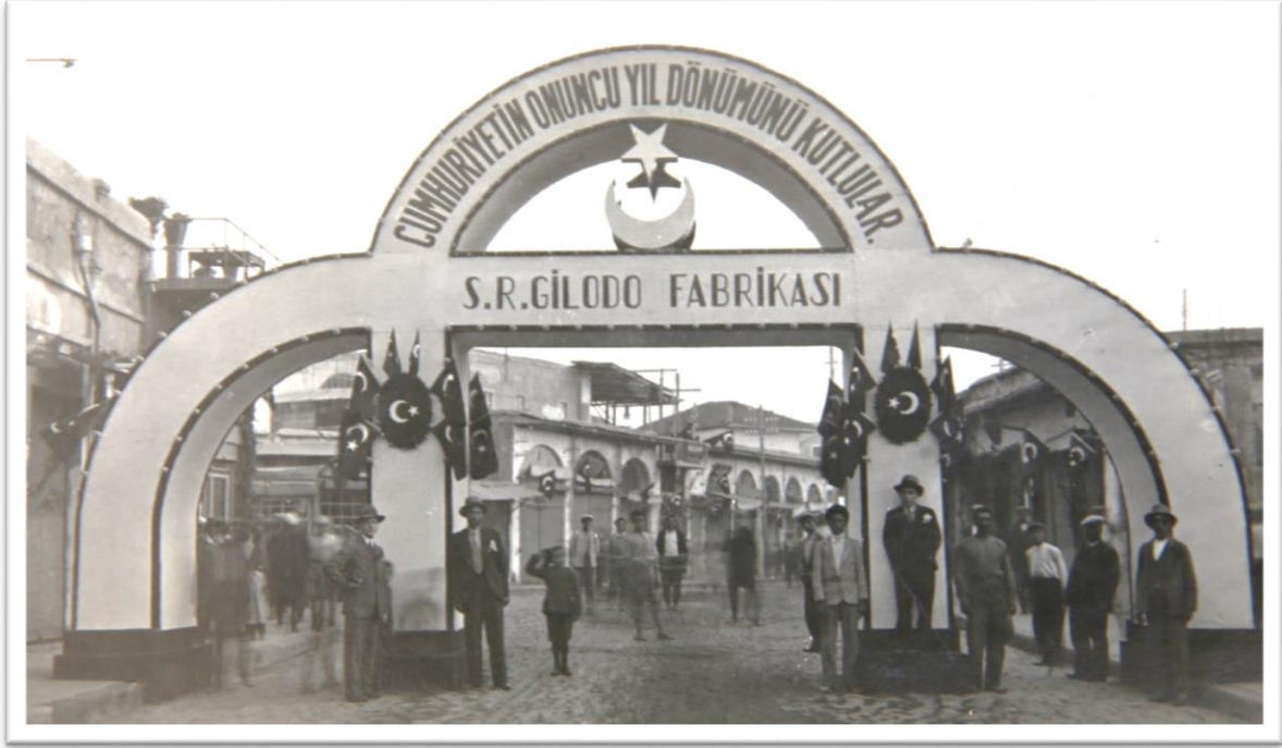
Görsel-7: S.R. Giledo Fabrikası taki