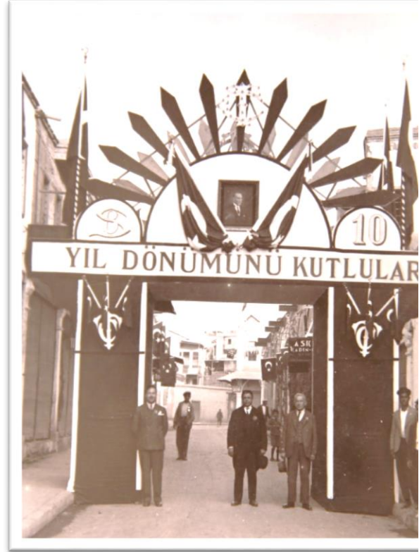
Görsel-4: Selânik Bankası takı