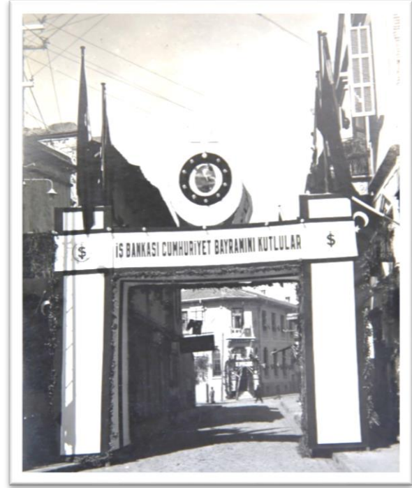
Görsel-6: İş Bankası takı