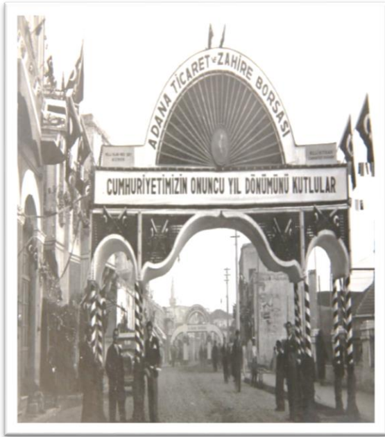
Görsel-11: Ticaret ve Zahir Borsası takı

İşveren gruplara ait kentin değişik cadde ve geçitlerine konulan taklar şu şekildeydi: