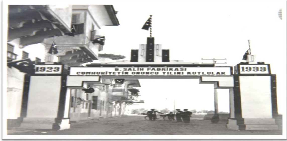
Görsel-9: B. Salih Fabrikası takı