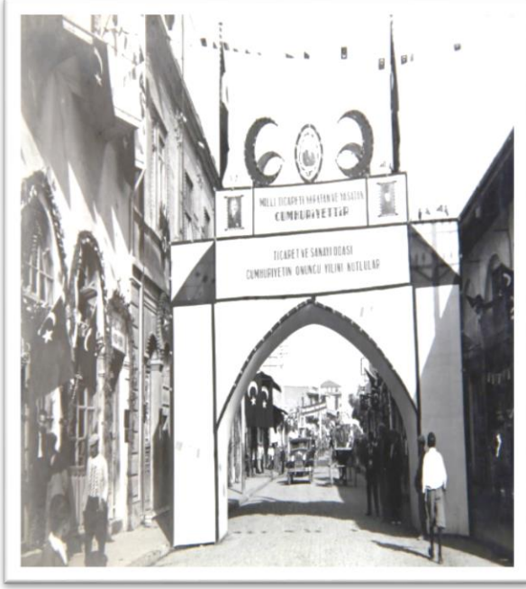
Görsel-13: Ticaret ve Sanayi Odası takı