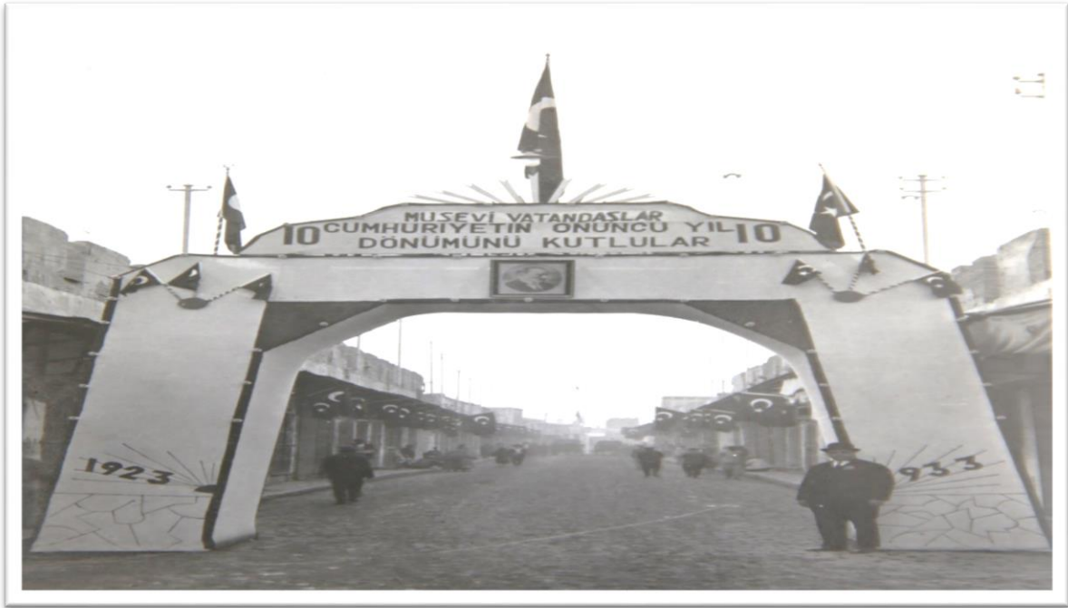
Görsel-16: Musevi Vatandaşlar takı