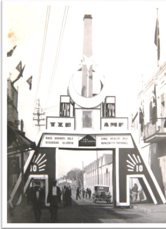
Görsel-3: Ziraat Bankası takı

Bankası (İş Bankası civarında).” İş, Selânik ve Osmanlı bankaları taklarında kare form şeklinde ve üzerinde Türk bayrakları asılı, ışıklı bezemeler öne çıkıyordu. Ayrıca “10” yazısının yanında İş ve Sümer bankaları taklarında “Atatürk” resmi vardı. Ziraat bankasının takı diğerlerinden farklıydı. Üçgen formda hazırlanan tak da ay-yıldızlı kaide başının altında “ayakta duran Atatürk resmi” vardı. Takın her iki ayağının birleşme noktasında iki cümle yazıyordu. İlk cümle “Önce, buğdayı bile dışarıdan alırdık”, ikinci cümle “Şimdi ipekliyi bile memlekette dikiyoruz” şeklindeydi. Adı geçen bu bankaların yaptırdığı taklar şu şekildeydi (Adana Alparslan Türkeş Bilim ve Teknoloji Üniversitesi Kütüphane Dokümantaston Daire Başkanlığı Arşivi, Görsel No:3-4-5-6, 1933):