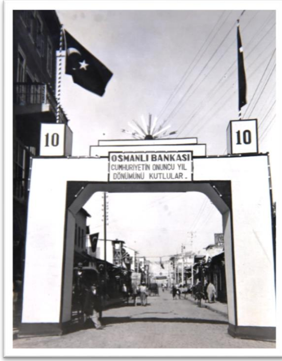
Görsel-5: Osmanlı Bankası takı