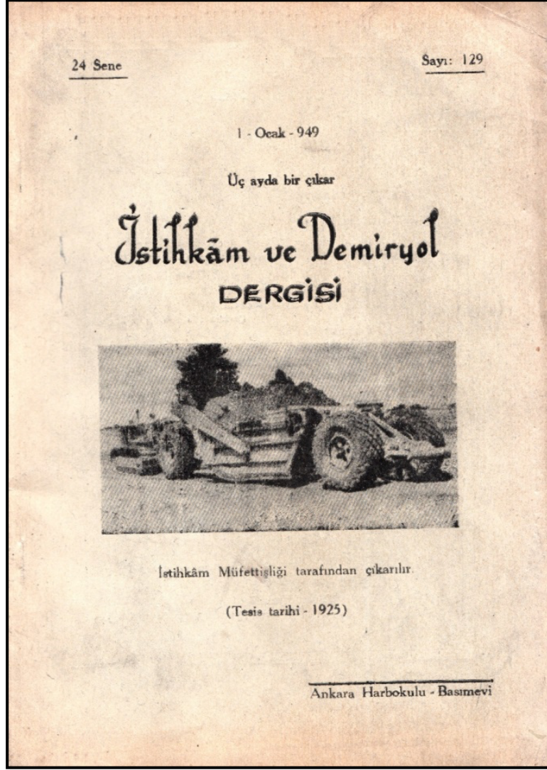
İstihkâm ve Demiryol Dergisi (İlk Sayı): Sayı: 129

Sonuç olarak denilebilir ki diğer sınıf dergileri gibi Fen Kıtaatı Mecmuası/Dergisi de Cumhuriyet Dönemi Türk Silahlı Kuvvetler Tarihi ile istihkâm, muhabere ve demiryol sınıflarına yönelik akademik çalışmalar yapacak olan akademisyenler için önemli bir kaynak özelliği göstermektedir.