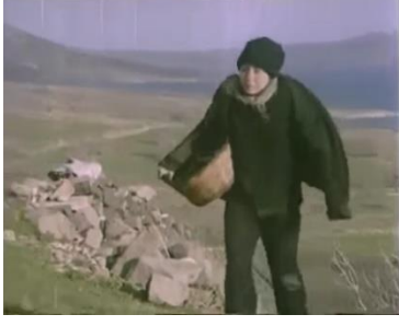
Kambur (1973). Azize Karakteri