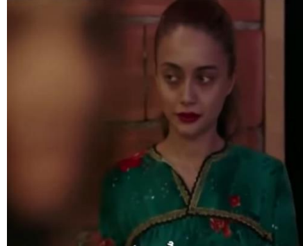
Sibel (2018). Köy düğünü sahnesinde Sibel

Bu tema öbeği altında tespit ettiğimiz üçüncü tema engelli kadının çekici olarak görülmemesine rağmen cinsel istismara maruz kalmasıdır. Engelli kadınların çekici olmadığı görüşü (Cole, 1986) yaygın olsa da cinsel istismara maruz kalmaktadırlar. Fiziksel engelli kadınlar, özellikle savunmasız olarak adlandırıldıklarından dolayı, cinsel sömürü nesnesi olmaktadır (Stromsness, 1994).