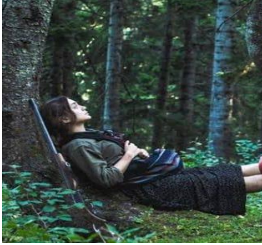
Sibel (2018). Sibel Karakteri

2000 Sonrası Türk Sineması: Sibel (Eche, ve diğerleri, 2018) filminde dilsiz olan Sibel karakterinin köy düğününe giderken ruj sürüp yeni kıyafetler giyerek süslenmesi ve bunun için ayıplanması aslında toplumun onlara biçtiği cinsiyetsiz olma rolü ile kendi sınırlarında savaşmasına örnektir. Dilsiz olup uğursuz görülen ve toplumdan dışlanan Sibel'in bir kadın gibi süslenmesi, onun cinsiyetini ortaya koyması hoş karşılanmamıştır. Zaten engelli kadınlar medyada genellikle cinsiyetsiz olarak tanımlanmaktadır (BCODP & Barnes, 1992).