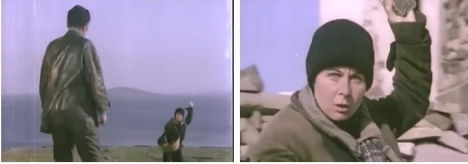
Kambur (1973). Azize'nin Selim'den kaçması

erkeklik gururuna yediremeyerek Azize'yi " or.s.u, or.s.ulduğundan tükürdü. Dün gece eve çağırdı gitmedim " sözleriyle aşağılamış ve dışlamıştır.