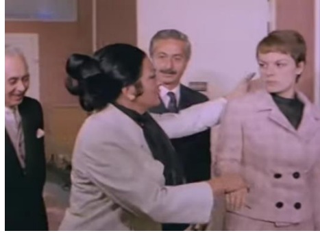
Kınalı Yapıncak (1969). Aliye karakteri yeğenine kalan mirası üzerine almak için imza attırmaya ikna ediyor.

2000 Sonrası Türk Sineması: Bu döneme ait filmlerde bu tür bir algı tespit edilmemiştir.