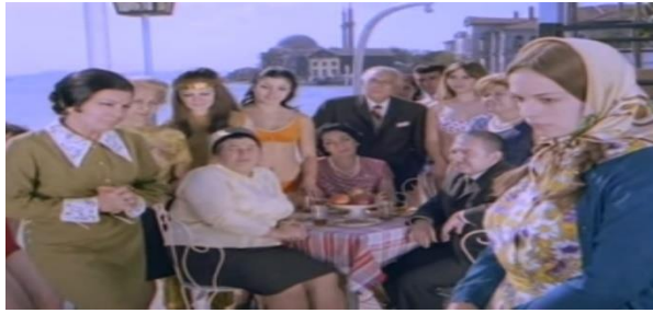
Kınalı Yapıncak (1968). Aliye karakteri arkadaşlarıyla Kınalı Yapıncak'ı tanıştırmak için

Yeşilçam Sineması : Kınalı Yapıncak (Ünal, 1969) filminde yangın sonucu ailesini kaybeden Kınalı Yapıncak sağır ve dilsiz kalmıştır. Köyde kalacak bir evi bile olmadığı için muhtar ile teyzesinin yanına şehre geldiklerinde dış görünüşü ve engelli olması nedeniyle teyzesi ve çevresindekiler tarafından hor görülmüştür. Teyzesi Kınalı Yapıncak'ı " İşte merhametin sonu, anasız, babasız, sağır, dilsiz, aptal bir kız, köyden getirttik. Acıdım, evlat edindim. " şeklinde takdim etmiştir. Burada karakter, tıbbi bakış açısıyla sinemada melodram öğelerinden olan muhtaç, çaresiz karakter tiplmesi ile sunulmaktadır. Karakterin topluma tanıtılmasında da aşağılama vardır. Kambur (Ünal, 1973) filminde balık satma sırasını ihlal eden fiziksel engelli Azize'ye kızanları " bırakın şu zavallıyla uğraşmayı " diyerek uyararak yetkilinin tavrı da muhtaçlığa bir örnektir.