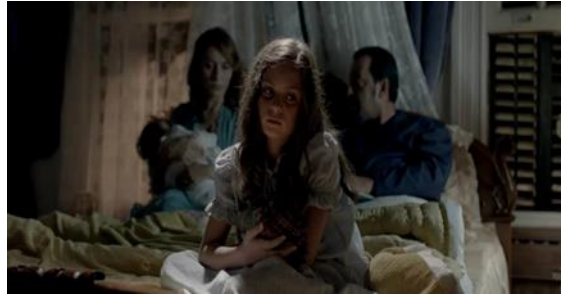
Benim Dünyam (2013). Ela'nın babası kızlarının akıl hastanesine kapatılması gerektiği yönünde söylemde bulunuyor.

2000 Sonrası Türk Sineması: Benim Dünyam (Avcı, 2013) filminde Ela karakterinin babasının "Ela bu evde olduğu üzere bize huzur yok" şeklindeki ifadesi ahlaki modeli simgelemektedir. Bu konuşmadan anlaşılacağı üzere ahlaki anlayışın ceza ödül bazlı düşüncesinde engelli kişiyi ceza olarak kabul etme söz konusudur. Bu tür bir bakış, engelliliğe karşı aşağılık ya da acıma temelli bir tutumu ve engellilerin günahın sonucu olduğuna ya da hayırseverliğe muhtaç olduğuna inanılan bir dünyayı yansıtmaktadır (Andrews, 2017). Sibel (Eche, ve diğerleri, 2018) filminde dilsiz Sibel karakteri halk arasında uğursuz olarak görülmektedir. Uğursuz ve kötü olarak engelli birey tasviri toplumsal bütünleşmedeki en büyük bariyerdir (BCODP & Barnes, 1992).