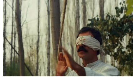
Gülüştan (1985). Mestan