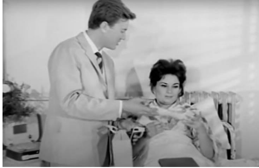
Yalnızlar İçin (1962)

Kenan ona topuklu ayakkabı almıştır. Burada karakterin tedavi sürecini tamamladıktan sonra "tam bir kadın" olması sunulmaktadır. Filmdeki bu bakış açısı tıbbi modeli birebir olarak yansıtmaktadır. Çünkü tıbbi modelin odak merceğinden engellilerin tasviri olumsuzdur, çünkü bu tür engelli insanlar, bozuklukları tedavi edilmezse sorunlu olarak algılanırlar (BCODP & Barnes, 1992).