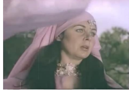
Kambur (1973). Azize Karakterinin rüyasındaki görünüşü