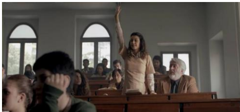
Benim Dünyam (2013). Ela

Sadece Sen (Tokat, 2014) filminde çalışan Hazal karakteri de negatif imajlarla mücadele eden karakter olarak karşımıza çıkmaktadır.