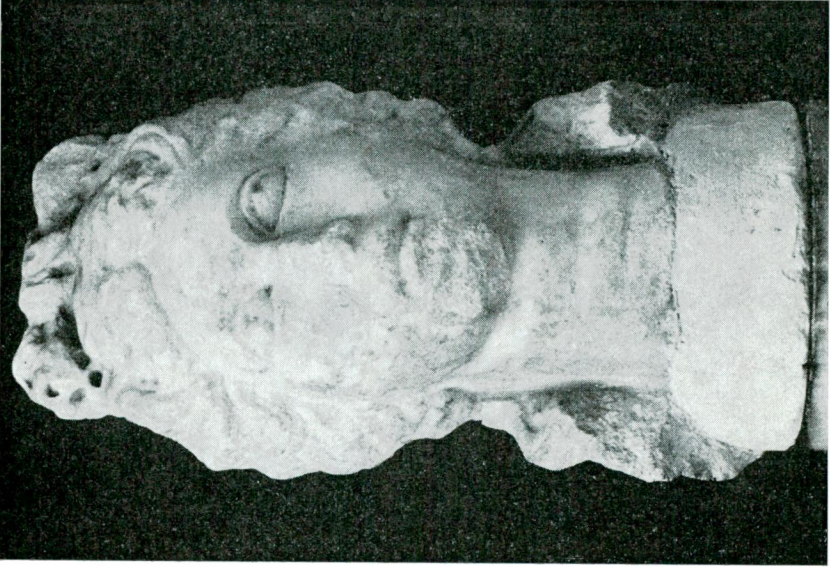
Res. 3 — Genç kadın başı (Flavius'lar devri).