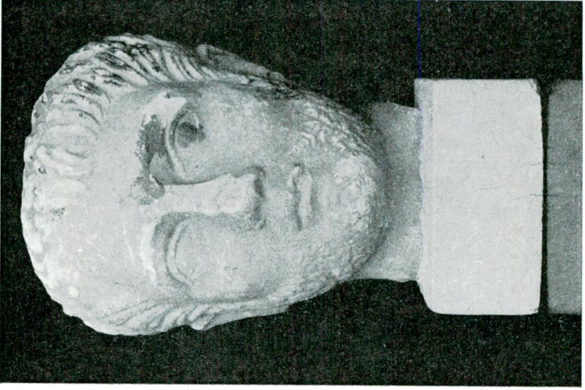
Res. 4 — Genç sakallı erkek başı (Hadrian devri).