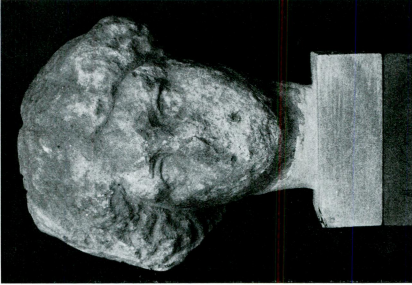
Res. 1 — Kadın başı (Julius - Clavdius'lar devri).