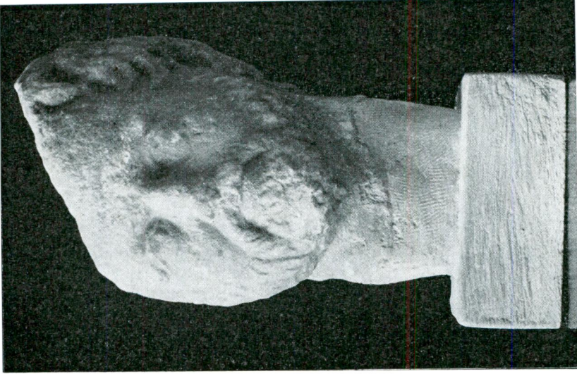
Res. 5 — Sakallı küçük erkek başı (Hadrian devri).