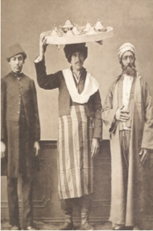
Resim 8. Osman Hamdi Bey (1999), De Launay, Victor Marie, 1873 Yılında Türkiye' de Halk Giysileri / Elbise-i Osmaniyye , Çev.: Erol Üyepazarcı.

XIX. yüzyılda, Avrupa'da, sanayi devrimiyle, ilk olarak erkek giyiminde başlayan 'zorunlu' değişim rüzgarları, tüm modernleşme hareketlerinde olduğu gibi Osmanlı'yı da etkisi altına almıştır. Osmanlı'da, bu mesleğe önderlik eden terzilerimiz, beklenen düzeyde olmasa da yayınlarıyla, araştırmalarıyla, günümüz moda ve tasarım eğitiminin ilk kaynaklarını oluştururlar. Bu dönemde yayımlanan özgün bir albüm, giyim tarihimiz açısından dikkatleri çeker. 1873 yılında, Victor Marie De Launay ile birlikte Osmanlı giyim tarihinin çok önemli bir belgeselini hazırlayan Osman Hamdi Bey'in Elbise-i Osmaniyye (Osman Hamdi Bey: 1999) albümü, giyim tarihimizin zenginliğine tanıklık etmesi açısından önemlidir (Resim 8).