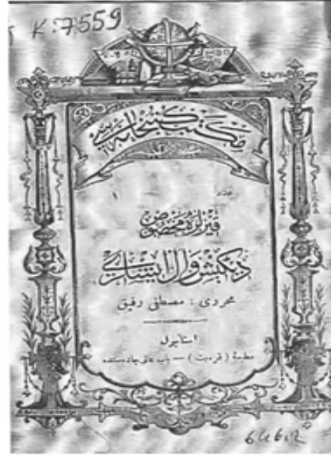
Resim 5. Mustafa Refik, Kızlara Mahsûs Dikiş ve El İşleri (1890) kitabının kapağı (G.Bike Sağduyu Belgeliği)

ilk ders kitabıdır. Yazarının adının A.B.L. kısaltmasıyla verildiği Terzilik Yâhûd Usûl-i Hayâtiyye , kitabı, dilimizde, -şimdilik- 'kalıp bilgisi öğretimi' için yayımlanan ilk kitaptır. Ölçü almaktan, entarinin göğüs ve etek kısımlarının kalıbını çıkarıp kesmeye ve dikmeye kadar bilgileri verirken doğal olarak erkek giyimine yönelik, iç çamaşırı, gömlek vb. bilgilerini de aktarmaktadır.