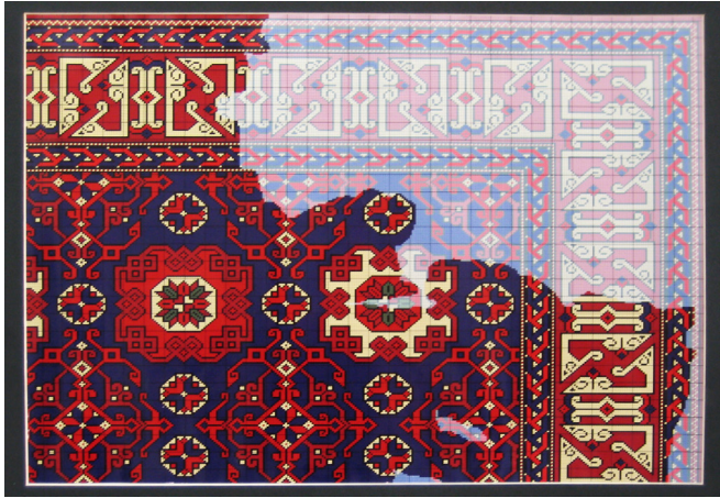
Çizim 1: Dokumada eksik olan bölgelerin orijinal renklerden daha açık bir tonda gösterilmesi

Orijin: Konya yöresi halı örneği, Çizimi yapan: Gözde Heptokkan, Yıl: 2007