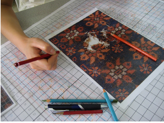
Fotoğraf 4. Restitüsyonu yapılan halı örnekleri halı kağıdına karelenmesi.