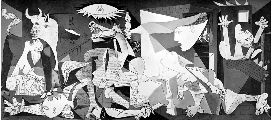
Görsel 3. Guernica tablosu, (Crpiemonte.medium.com, 2022)

Yaşanan bu kanlı olayın bir sanat eserine konu olmasında Çolak (2019) tarafından yapılmış çalışmada Ocak 1937 yılında İspanyol Büyükelçiliği tarafından Dünya Fuarı'ndaki İspanyol Pavyonu'na Picasso'nun bir resimle katılmasının istenmesi etkili olduğu belirtilmiştir.