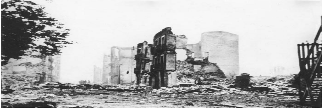
Görsel 1. Alman Hava Güçleri tarafından bombalanan Guernica kasabası, (Cрпиemonte.medium.com, 2018)

Sanat eserleri tarihi bir vesika olma görevlerini yerine getirirken konularının bazen yaşanmış olaylardan alırlar. Bu alandaki en bilinen çalışmalardan bir tanesi Guernica'dır. Guernica (Lesser, 2011, aktaran Kınam, 2020) ‘‘26 Nisan 1937’de Franco’nun gövde gösterisi için Guernica isimli küçük Bask kasabasının havadan bombalanmasıdır. Guernica, ‘Bask öz yönetiminin merkezi’ olarak bilinen Bask adıyla Gernica, demokratik düzene sahip özerk bir kasabadır. Bask bağımsızlığını, özerk bir devleti tehdit olarak gören Francisco Franco böylesi devrimci idealleri ezmek için Nazi Condor Lejyonu tarafından kasabanın üzerine 26 Nisan 1937 pazar günü bombalar yağdırmıştır’’ Bu kanlı olay sonrasında Guernica harabe hale gelmiştir.