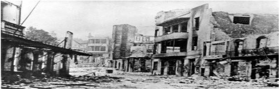
Görsel 2. Alman Hava Güçleri tarafından bombalanan Guernica kasabası, (Cрпиemonte.medium.com, 2022)