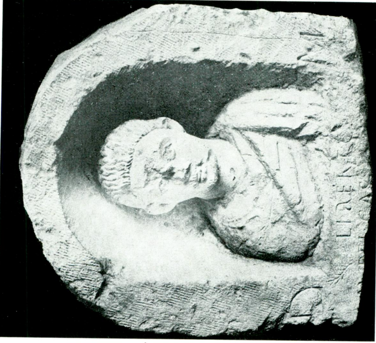
Res. 4 — Ankara Arkeoloji Müzesinde Gaziantep'ten gelen mezar stelinin önden görünüşü.