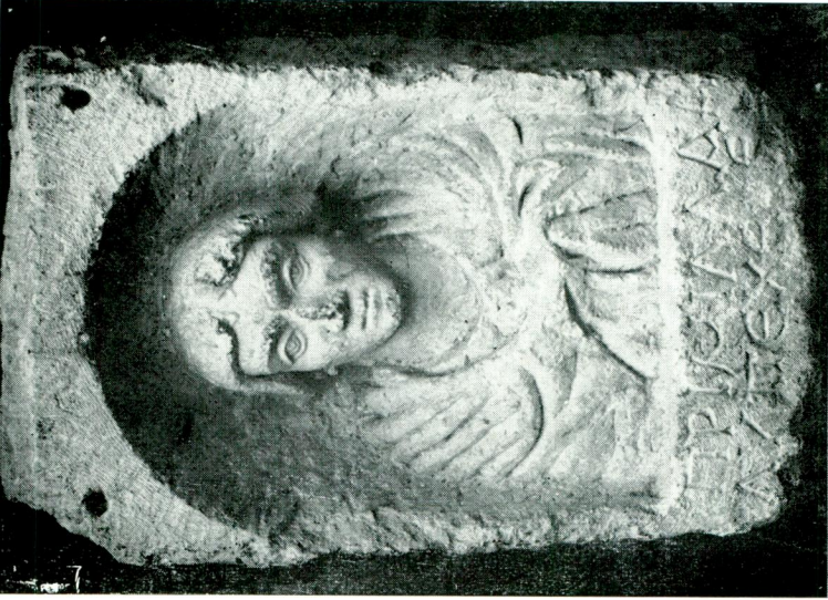
Res. 1 — Ankara Arkeoloji Müzesinde, Belkis'tan gelen mezar stelinin önyüzü.