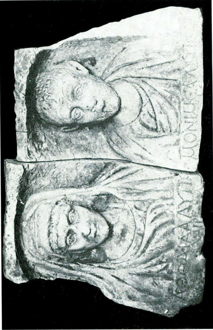
Res. 3 — İstanbul Arkeoloji Müzesinde Nizip'ten (Gaziantep) gelen mezar steli (Envanter No. 5519).