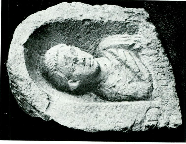
Res. 5 — Ankara Arkeoloji Müzesinde, Gaziantep'ten gelen mezar stelinin yandan görünüşü.