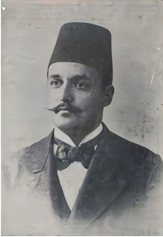
1 Hamdi Kenan Bey (Ma'lûmât gazetesi, 1902)

Enderûn Mektebi'nin 1 Temmuz 1909'da kapatılması ile sanatçının resim muallimliği görevi sona ermiş, ancak devlet memurluğu görevi emekli oluncaya kadar devam etmiştir. Arşiv belgelerinden anlaşıldığı kadarıyla, II. Meşrutiyet'in ilanını müteakip Hamdi Kenan Bey'in görev yeri değişmiş, Bahriye Nezareti tercüme kalemine bağlı Almanca mütercimliğine tayin edilmiş, 20 Temmuz 1916'da (R. 7 Temmuz 1332) da emekliliğe sevk edilmiştir. 26 Sanatçının vefat tarihi ile ilgili herhangi bir bilgiye ulaşamamıştır.