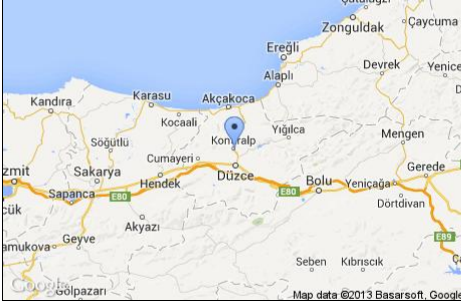
Şekil 1. Düzce İl'i ve Konuralp Beldesinin Haritadaki Konumu

Belde, engebeli bir araziye sahip, merkezi kısımda rakım 250 metredir. Beldede halen tarımla uğraşılmaktadır. Mısır, fındık ve büyük oranda pirinç ekimi Osmanlı İmparatorluğu döneminden beri yapılmaktadır. Kasaba Pirinci diye bilinen pirinç, Osmanlı Saray Sofralarının baş tacı olmuştur. Belde de hayvancılıkla da uğraşılmaktadır. Bölgede tarım ve hayvancılığın yanı sıra büyük çapta sanayi kuruluşları da bulunmaktadır.