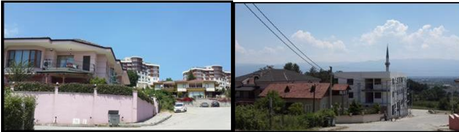
Şekil 3. İmar Planındaki Emsal Artışın Mekâna Yansması

Bu mahalle de gridal-ızgara plan şemasına sahiptir. Fakat yollar diğer iki mahalleye göre daha geniştir ve yollara cephe alan 4-5 katlı apartman tipi yapılaşma düzeni vardır. Plan tadilatları ile artırılan yoğunluklar ve farklı parsel içi çekme mesafeleri nedeniyle var olan konut dokusuna uymayan, hem kütleli hem yükseklik olarak aykırı görüntüler şekil 3 te görüldüğü gibi ortaya çıkmıştır. Bu tadilatlar, sürekliliği olmayan yollar, tanımsız ve kurallara uygun olmayan kavşakların oluşmasına neden olmaktadır.