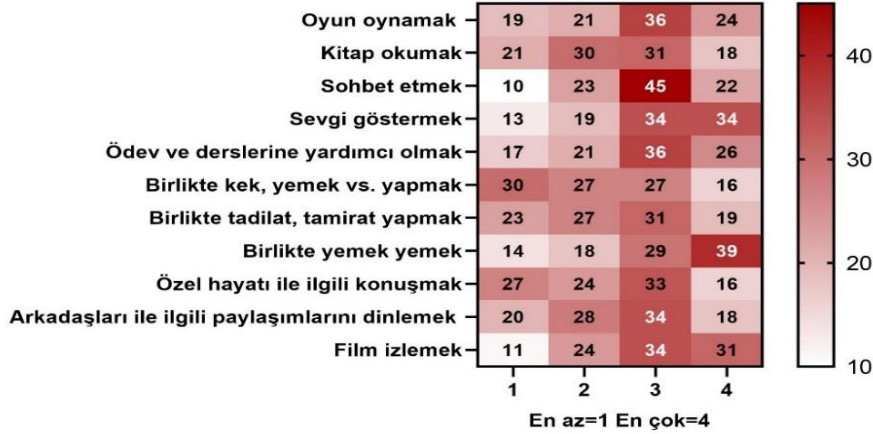
Şekil 2. Pandemi Döneminde Babaların Çocukları İle Paylaşımlarda Buldukları Alanlardaki Değişimlerin Pandemi Öncesine Kıyasla Değişimi.

Pandemi döneminde babaların çocukları ile paylaşımlarda buldukları alanlardaki değişimlerin pandemi öncesine kıyasla değerlendirmelerine ilişkin yüzde değerleri Şekil 2’de sunulmuştur.