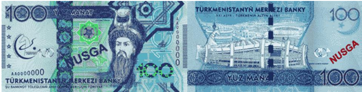
2017 Serisi Ön Yüz