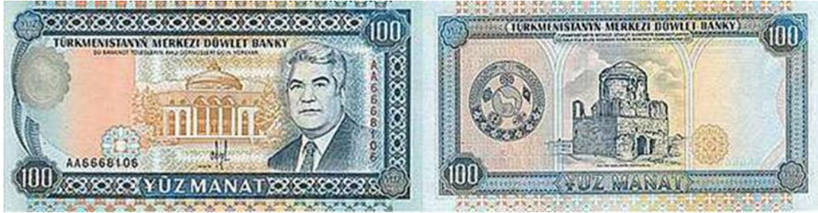
1993 Serisi Ön Yüz

Fotoğraf 2: Niyazov dönemi ve sonrası ulusal para görsellerindeki değişimden örnekler