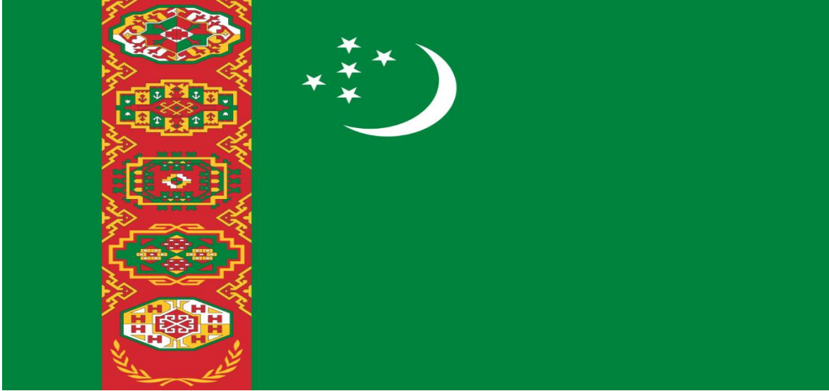
Fotoğraf 1: Türkmenistan bayrađı ve üzerindeki motiflerin anlamları

beraber ele alındığında ise yine etnik anlamda ortak payda olan Türklük mefhumu simgeler. Bayrakta yer alan motifler dünyaca ünlü Türkmenistan halısını simgelerken, halıdaki 5 motif ülkenin en büyük beş kabilesini temsil eder.