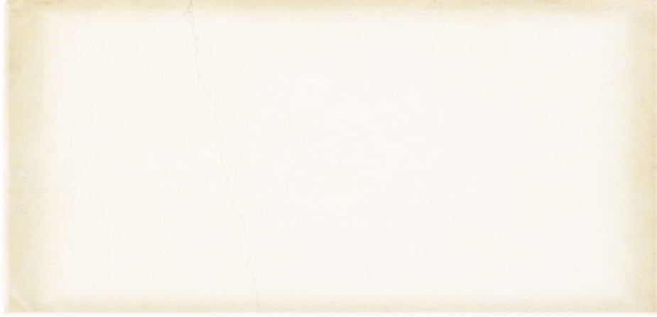
řekil 3. 6. Sınıf Milli Mücadele ve Atatürk Temasındaki Bir Yaratıcı Yazma Etkinlięi

Metindeki yařlı nine, köyüne döndükten sonra neler yařamıř olabilir? Bu konuda hikäye edici bir metin yazınız.