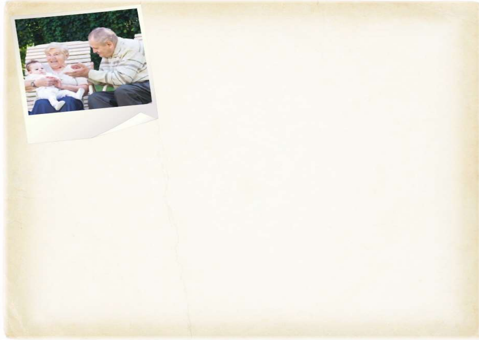
Şekil 8. 6. Sınıf Sağlık ve Spor Temasındaki Bir Yaratıcı Yazma Etkinliği

Aşağıdaki fotoğrafla ilgili duygularınızı anlatan bir şiir yazınız.