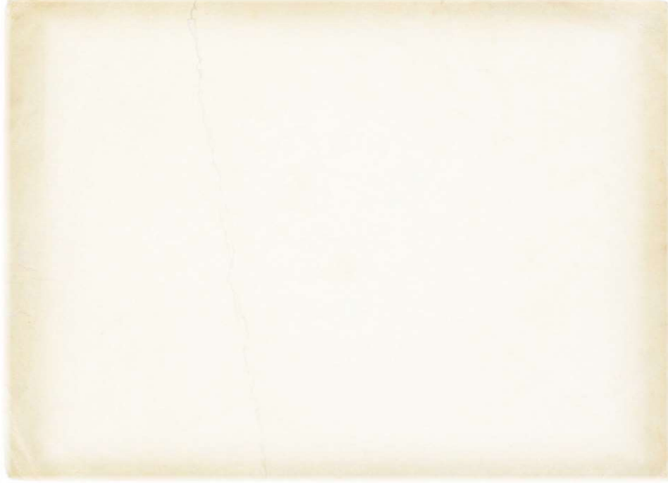
Şekil 7. 6. Sınıf Bilim ve Teknoloji Temasındaki Bir Yaratıcı Yazma Etkinliği

“Hangi yenilenebilir enerji kaynağından enerji üretmek ekolojik dengeye daha az zarar verir?” sorusunun cevabını “Yosun Pilleri” metninden hareketle düşününüz. Cevabınızı, günlük hayattan örneklerle destekleyerek aşağıya bilgilendirici bir metin yazınız.