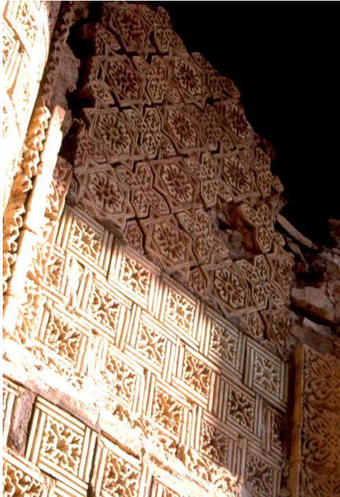
Res. 5 – Ayşe Bibi Türbesi, batı cephenin kuzey kesimi.