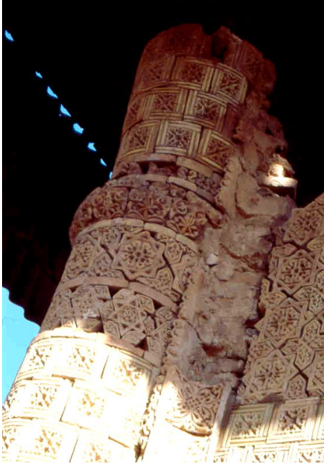
Res. 7- Ayşe Bibi Türbesi, batı cephenin kuzey tarafının üst kesimi.