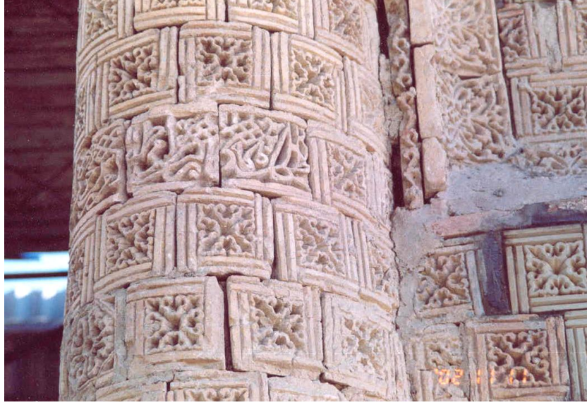
Res. 9 – Ayşe Bibi Türbesi, batı cephenin kuzeyindeki sütunda yer alan kitabe.