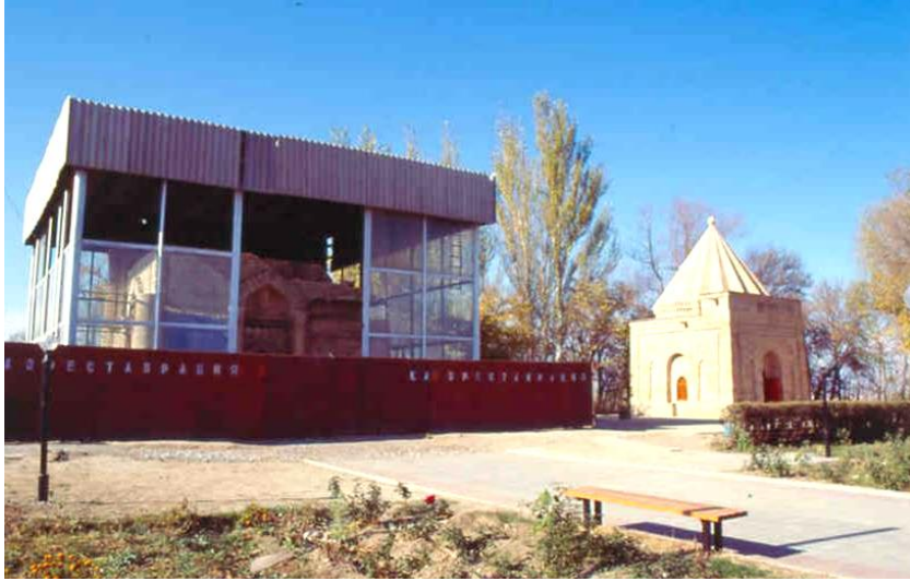
Res. 1- Ayşe Bibi Türbesi. Genel görünüş.