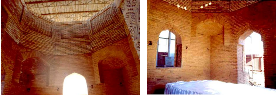
Res. 12 – Ayşe Bibi Türbesi, doğu duvarı ve kuzeydoğu köşesi.