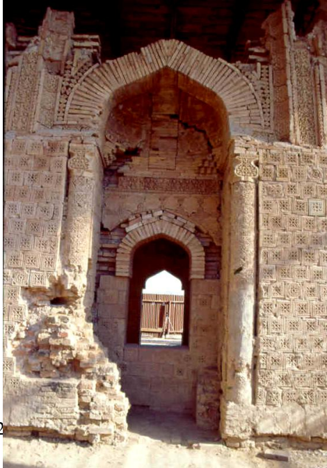
Res. 10 – Ayşe Bibi Türbesi, batı cephedeki eyvan.