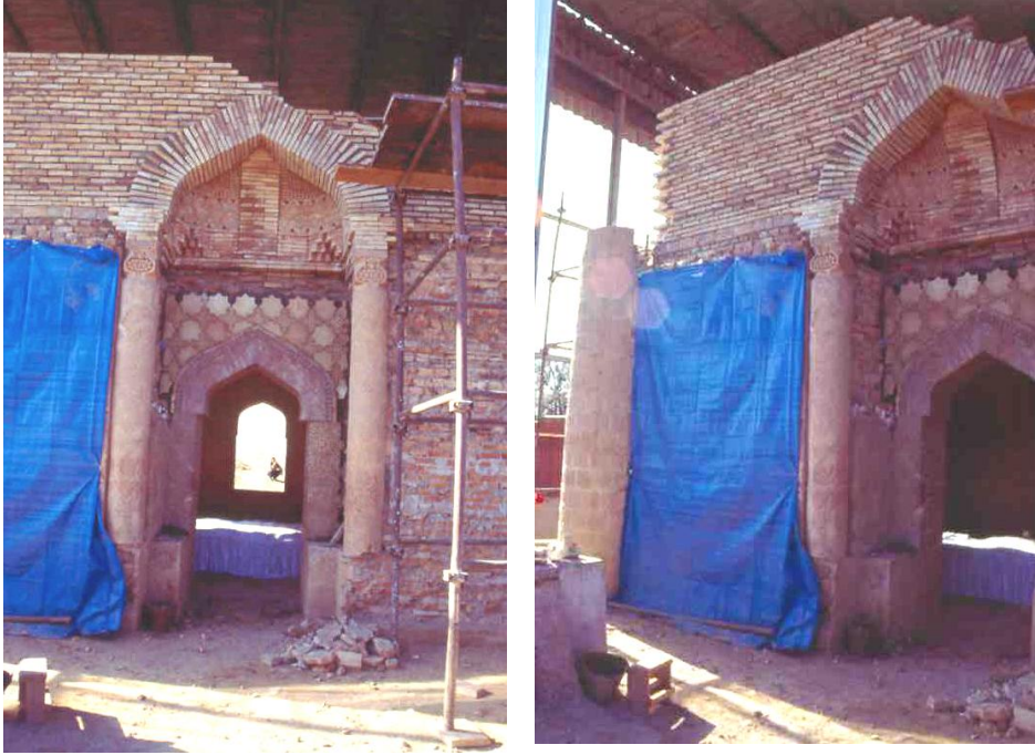
Res. 3- Ayşe Bibi Türbesi, doğu cephe.