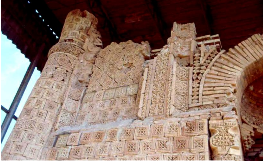
Res. 5 – Ayşe Bibi Türbesi, batı cephenin kuzey kesimi.