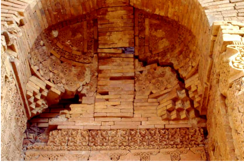
Res. 11 – Ayşe Bibi Türbesi, batı cephedeki eyvanın kavsarası.