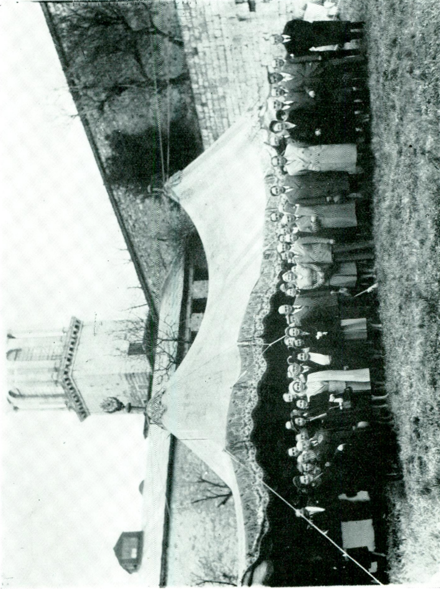
Res. 1 — Memleketimizde müzelerin kuruluşunun 100. yılında (1948) Topkapı Sarayı Müzesinde yapılan törende konuklardan bir kısmı otağ önünde.