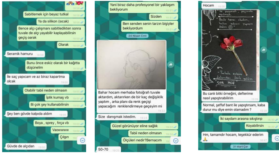
Şekil 1. Araştırmacının öğrencileri ile WhatsApp aracılığıyla kurduğu iletişim örnekleri (Bilici Öztürk, 2022)

sonunda yine uzman görüşlerinin bilgisi halinde değerlendirilebilmeleri için, görsel envanterler, yazılı bilgi ve bulgular, Dicle Üniversitesinde Resim-İş Eğitimi alanında çalışan bir öğretim üyesi ve Ankara Milli Eğitim Bakanlığına bağlı bir eğitim kurumunda çalışan bir uzman öğretmen tarafından görüşleri alınarak değerlendirme yapılmış ve bulgular kısmında paylaşılmıştır. Öğrencilerden alınan veri ve bulgular araştırmacı tarafından toplanarak çözümlenmiş ve rapora dönüştürülmüştür. Araştırmacının A/r/tografi yöntemine uygun olarak kullandıkları veri kaynakları örnekleri Şekil 1’de gösterilmiştir.