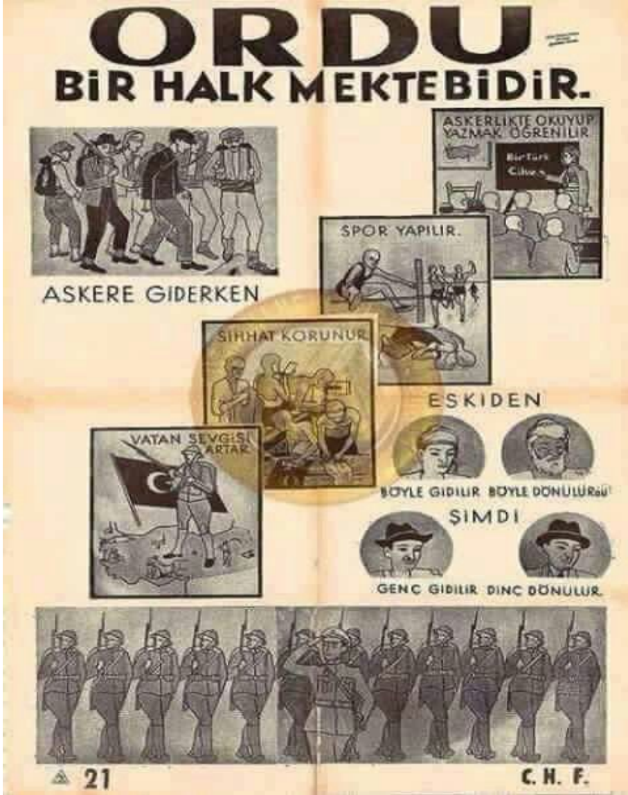
Ek-1. 1930'lu Yıllar Cumhuriyet Halk Fırkası (CHF) Propaganda Afişi.