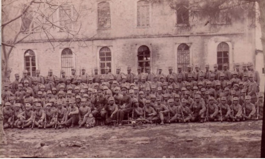
Ek-7. Silvan Jandarma Okuma Yazma Okulu Eğitimi Gören Erler ( Jandarma Genel Komutanlığı 50 Yıl Cumhuriyetin Hizmetinde , Jandarma Genel Komutanlığı, Ankara 1973).