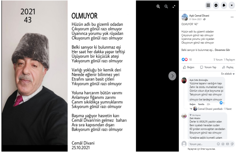
Görsel 2: Şiire Cevap Verilmesi (URL-10)

Âşık, geleneksel konularda şiirler “klavyeye aldığı” gibi gündeme dair şiirler de oluşturup paylaşmaktadır. Facebook’ta paylaştığı “Müge Anlı Esra Erol Yüzünden” (URL-11), “Korkuttun Korona” (URL-12) “Facede” gibi birçok şiiri bu duruma örnek teşkil etmektedir. Âşığın bu gibi şiirlerinin konuları bakımından medya ile alakalı olduğu söylenebilir. Özellikle “Facede” adlı şiiri Türk Facebook kültürünü açıklayıcı niteliktedir.