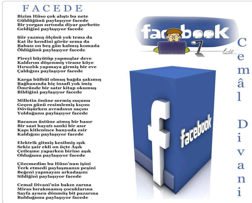
Görsel 3: Cemal Divani'nin Facede Şiiri (URL-13)

Âşık, geleneksel konularda şiirler “klavyeye aldığı” gibi gündeme dair şiirler de oluşturup paylaşmaktadır. Facebook’ta paylaştığı “Müge Anlı Esra Erol Yüzünden” (URL-11), “Korkuttun Korona” (URL-12) “Facede” gibi birçok şiiri bu duruma örnek teşkil etmektedir. Âşığın bu gibi şiirlerinin konuları bakımından medya ile alakalı olduğu söylenebilir. Özellikle “Facede” adlı şiiri Türk Facebook kültürünü açıklayıcı niteliktedir.