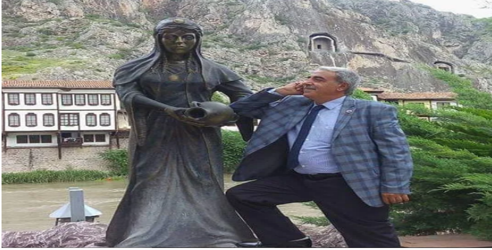
Görsel 5: Cemal Divanî Saygı Gecesi (URL-19)

kapsamda âşıklık geleneğinde âşıkların farklı yörelere gitmeleri, 9 gittikleri yörelerde izler bırakması geleneği dönüştürerek sosyal medyada yaşatılır hâle getirilmektedir. Âşık, gezdiği yörede ön planda olan kültürel unsurlarla fotoğraf çekilerek bunları takipçileri ile paylaşmaktadır.