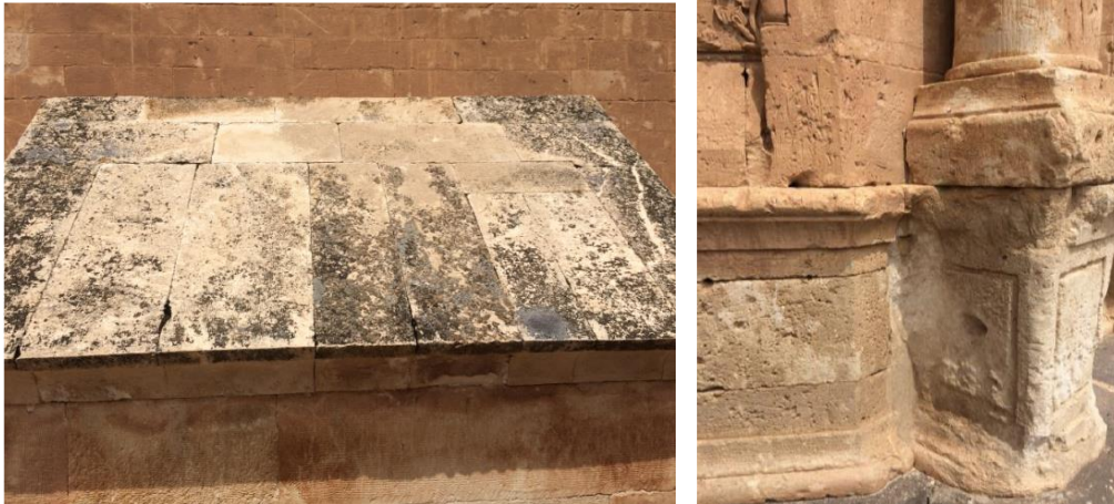
Şekil 3. Sırasıyla Çiçeklenme ve Tozlaşma Oluşumu (Artık ve Turan, 2018)

Kültürel mirasın biyolojik nedenlerle bozulması evrenin her yerinde karşılaşılan bir koruma problemidir. Binaların içerisinde ya da malzemesinde yaşayan canlı organizmalar nem ile sıcaklık gibi çevresel koşullardan etkilenmektedir (Sabbioni vd., 2012). İklimsel değişimler nedeniyle istilacı türler çoğalmakta, yeni ya da mevcut böcek çeşitleri yayılmaktadır. Bu durum kültürel mirasın hasar görmesine özellikle de cephe yüzeylerinde çiçeklenme, tozlaşma gibi oluşumların daha da artmasına yol açmaktadır (Şekil 3). Ayrıca küf miktarında meydana gelen artışlar arkeolojik alanlarda, bina ve strüktürlerde, kültürel peyzajlarda, etnografik kaynaklarda, müze koleksiyonlarında istilacı türleri fazlalaştırmaktadır (Rockman, 2015).