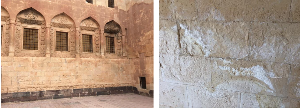
Şekil 2. Sırasıyla Kararma ve Tuzlanma Oluşumu (Artık ve Turan, 2018)

Kültürel mirasın biyolojik nedenlerle bozulması evrenin her yerinde karşılaşılan bir koruma problemidir. Binaların içerisinde ya da malzemesinde yaşayan canlı organizmalar nem ile sıcaklık gibi çevresel koşullardan etkilenmektedir (Sabbioni vd., 2012). İklimsel değişimler nedeniyle istilacı türler çoğalmakta, yeni ya da mevcut böcek çeşitleri yayılmaktadır. Bu durum kültürel mirasın hasar görmesine özellikle de cephe yüzeylerinde çiçeklenme, tozlaşma gibi oluşumların daha da artmasına yol açmaktadır (Şekil 3). Ayrıca küf miktarında meydana gelen artışlar arkeolojik alanlarda, bina ve strüktürlerde, kültürel peyzajlarda, etnografik kaynaklarda, müze koleksiyonlarında istilacı türleri fazlalaştırmaktadır (Rockman, 2015).